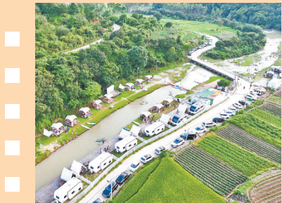
河市镇新告村露营房车基地航拍图

此外,洛江在全省率先搭建“洛阳江5G+数字孪生流域”平台,荣获第六届“绽放杯”水利海洋专题一等奖;在全国首创建设生态警务展示馆,相关经验获公安部和省公安厅充分肯定。一幅天更蓝、山更绿、水更清的美丽画卷正在洛江绘就。