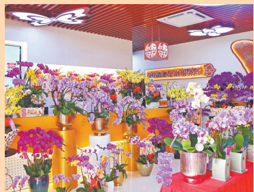
马甲镇永安村蝴蝶兰基地