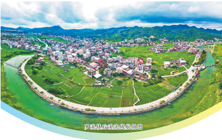
罗溪镇后溪流域航拍图