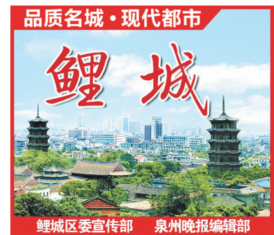
鲤城区委宣传部 泉州晚报编辑部

作为世遗古城核心区,鲤城文化底蕴深厚,资源禀赋独特,本次活动不仅是鲤城区推动泉州文化走进全国高校的一次创新实践,更是增强年青一代文化认同与家乡自豪感的重要举措。“我们以贴近年轻人的方式,将优秀传统文化与现代创意相结合,既拓宽了文化传承的路径,也搭建了鲤城与外界对话的桥梁。”活动主办方相关负责人表示,希望每一位远行的学子都行动起来,成为家乡文化的推介官和传播者,带动更多人走进鲤城、了解鲤城、爱上鲤城,共同助力古城文旅蓬勃发展。(李莹 李梦娴)