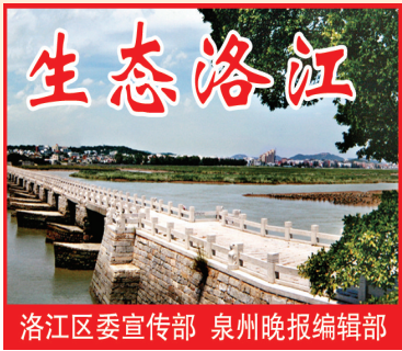
洛江区委宣传部 泉州晚报编辑部

获评国家生态文明建设示范区、全省林下经济示范县,永安村、洪四村入选首批省级乡村振兴示范村,2025年上半年农业总产值同比增长7.6%,农村居民人均收入增长5.8%……近年来,洛江区立足本土实际,深入实施“千村示范引领、万村共富共美”工程,全力推动乡村全面振兴不断迈上新台阶。