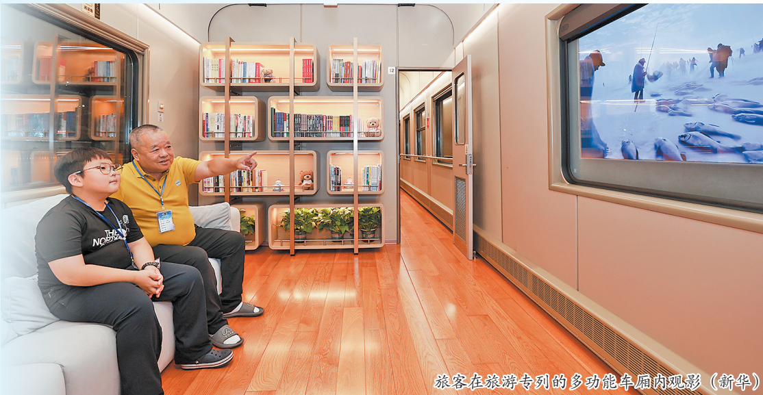
旅客在旅游专列的多功能车厢内观影(新华)

今年暑运,万千旅客坐着火车去感受“诗和远方”。来自中国国家铁路集团有限公司的数据显示,暑运以来,全国铁路已累计开行旅游列车500余列。