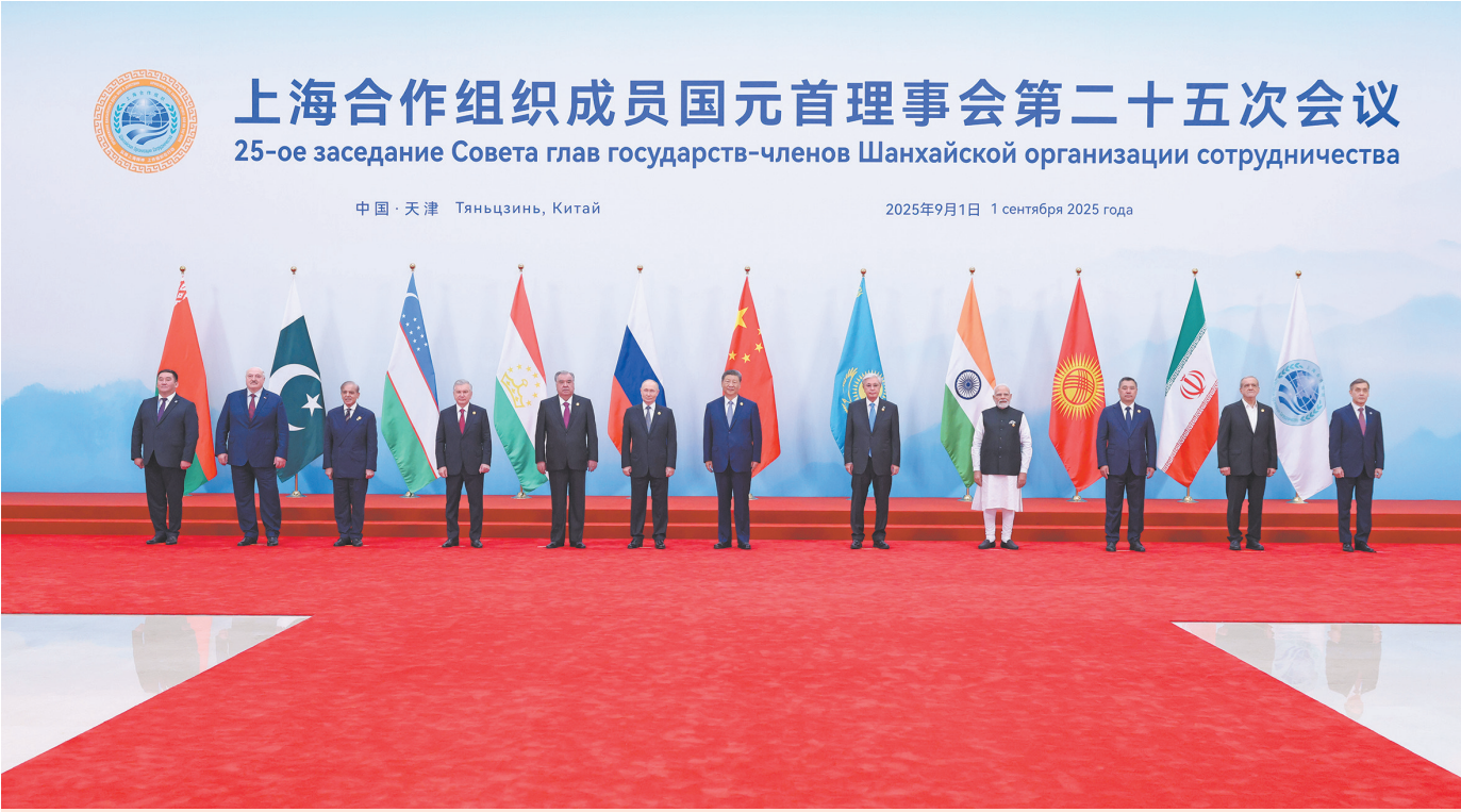
9月1日上午,上海合作组织成员国元首理事会第二十五次会议在天津梅江会展中心举行。中国国家主席习近平主持会议并发表题为《牢记初心使命 开创美好未来》的重要讲话。这是习近平同出席会议的上海合作组织成员国领导人、常设机构负责人集体合影。

新华社天津9月1日电 9月1日上午,上海合作组织成员国元首理事会第二十五次会议在天津梅江会展中心举行。中国国家主席习近平主持会议并发表题为《牢记初心使命 开创美好未来》的重要讲话。