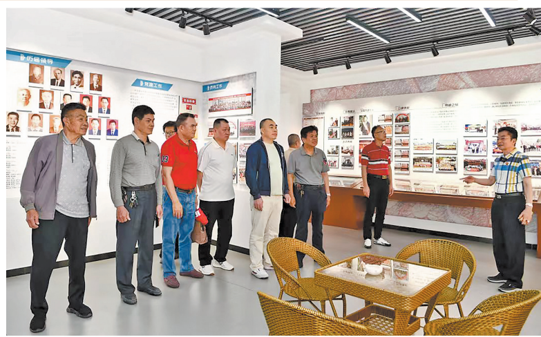
日前,福建籍南侨机工后人共缅机工魂