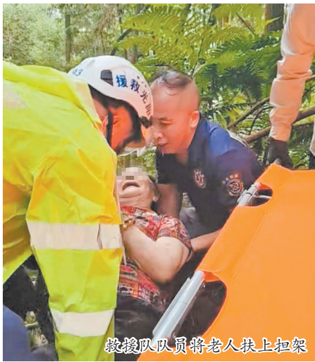
救援队队员将老人扶上担架

最后,大家小心地用担架将老人抬下山并送往医院做进一步检查。后经检查老人并无大碍,已被家属接回。