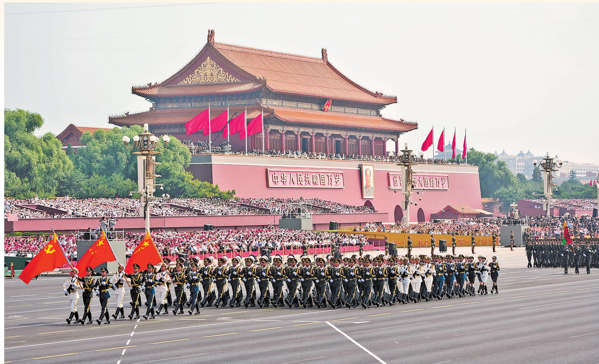
9月3日，纪念中国人民抗日战争暨世界反法西斯战争胜利80周年大会在北京隆重举行。这是中国人民解放军仪仗方队接受检阅。

中央军委主席习近平签署通令嘉奖参加中国人民抗日战争暨世界反法西斯战争胜利80周年阅兵全体人员