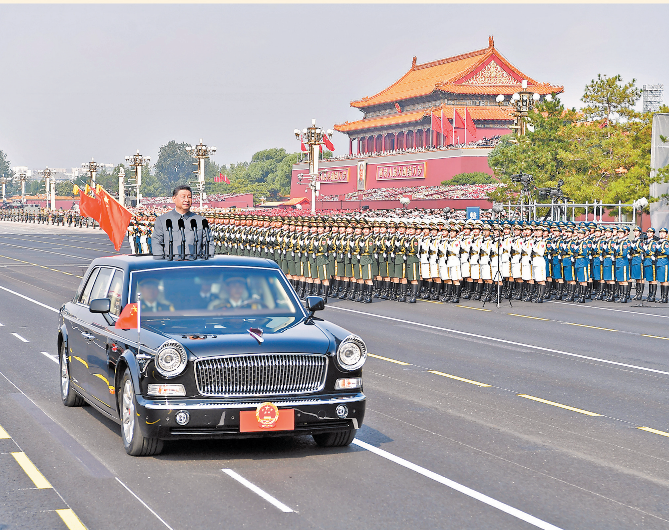
9月3日，纪念中国人民抗日战争暨世界反法西斯战争胜利80周年大会在北京天安门广场隆重举行。这是中共中央总书记、国家主席、中央军委主席习近平检阅受阅部队。

新华社北京9月3日电 铭记伟大历史胜利，凝聚正义和和平力量。9月3日上午，纪念中国人民抗日战争暨世界反法西斯战争胜利80周年大会在北京天安门广场隆重举行，以盛大阅兵仪式，同世界人民一道纪念这个伟大的日子，共同开创更加光明的未来。中共中央总书记、国家主席、中央军委主席习近平发表重要讲话并检阅受阅部队。