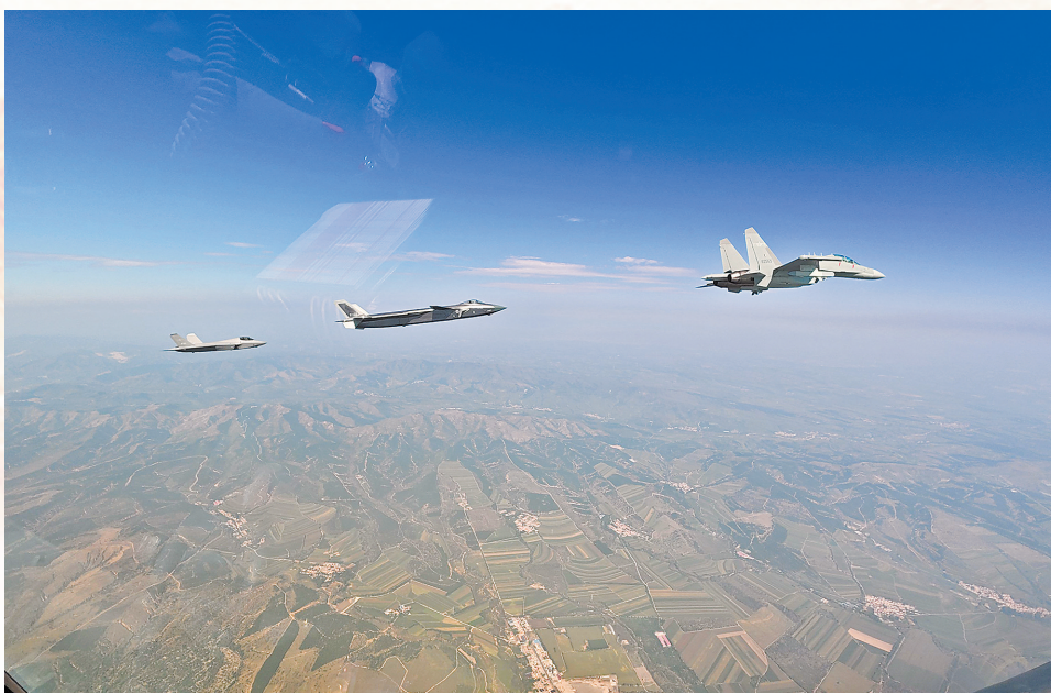
9月3日，纪念中国人民抗日战争暨世界反法西斯战争胜利80周年大会在北京隆重举行。这是歼击机梯队。