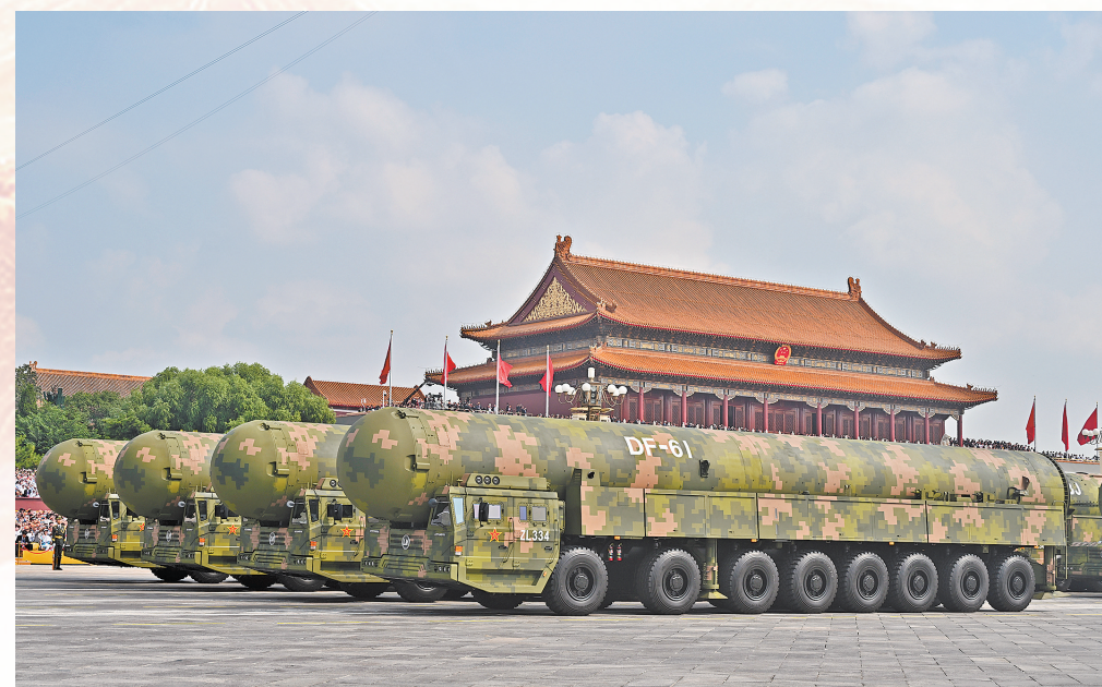
9月3日，纪念中国人民抗日战争暨世界反法西斯战争胜利80周年大会在北京隆重举行。这是核导弹第一方队接受检阅。