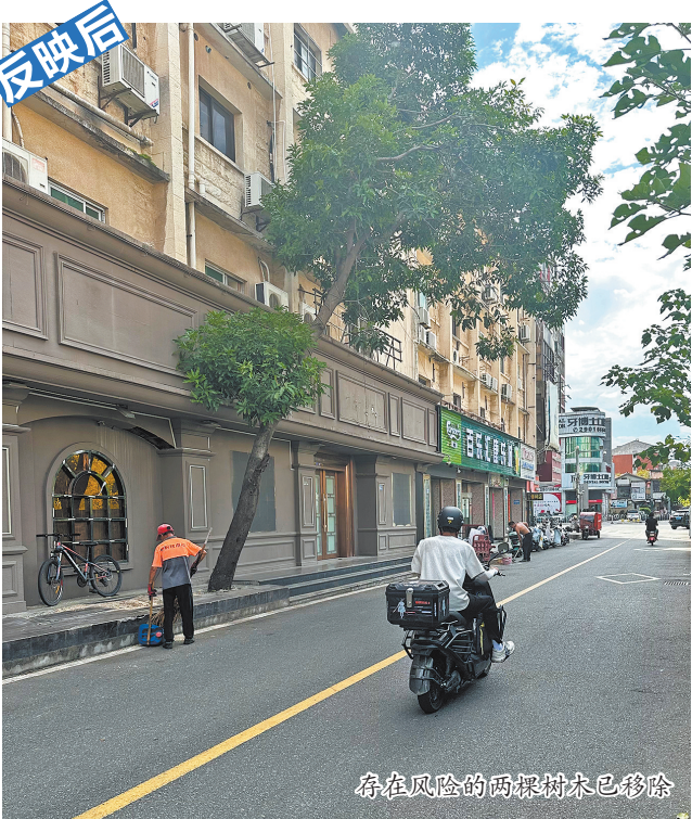
存在风险的两棵大树已移除

本报讯(融媒体记者刘燕婷 文/图)泉州中心市区温陵北路158-8号(原八一酒店南侧)附近的三棵芒果树,长期处于倾斜生长状态,市民担心出现倒伏,给过往行人和车辆带来安全隐患。上周三,本报对此事进行报道,并将问题反映给鲤中街道办事处处理。昨日,记者获悉,其中存在安全风险的两棵芒果树已移除。