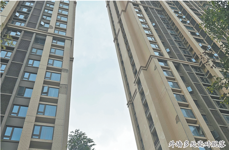
外墙多处瓷砖脱落