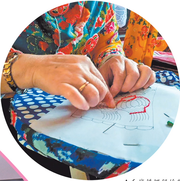
▲毛线绣缀仔的制作过程颇为讲究。图为惠安女沿着画好的线稿,用辫线绣出图案的轮廓。

一抹花头巾,让勤劳的惠安女在碧海蓝天间绽放别样风情。而错落分布,用毛线、珠绣等精心制成的缀仔,则将头巾点缀得熠熠生辉,也把惠安女乐观豁达的生命力演绎得淋漓尽致。这一枚枚手工装饰物,是惠安女服饰里的“灵魂”,在方寸之间尽显惠女文化的独特美学。