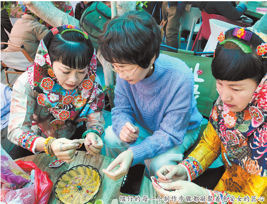
缀仔的每一个制作步骤都凝聚着惠安女的匠心

记者从惠安县文旅局获悉,一系列精心策划的主题文旅活动与文创商品大赛等多元传播载体,让缀仔的推广拥有了更广阔的平台。4月,“海韵惠安·匠心礼赞”文创商品大赛落下帷幕。在众多参赛作品,《如约巧遇惠安女手工绣品(缀仔)》脱颖而出,成为让人眼前一亮的获奖佳作。这件作品将“惠女+非遗服饰”深度融合,让传统的缀仔工艺焕发新生,同时以“惠女+文创产品”的创新模式,让缀仔这一蕴含深厚文化的元素走进大众生活。今年8月,“NOW热一夏”世遗泉州古城徒步穿越活动终场来到惠安崇武古城。活动现场,为徒步参与者分发了惠女服饰中经典的花头巾与缀仔装饰物,让参与者在体验徒步乐趣的同时,近距离接触和感受惠安女服饰文化的魅力。