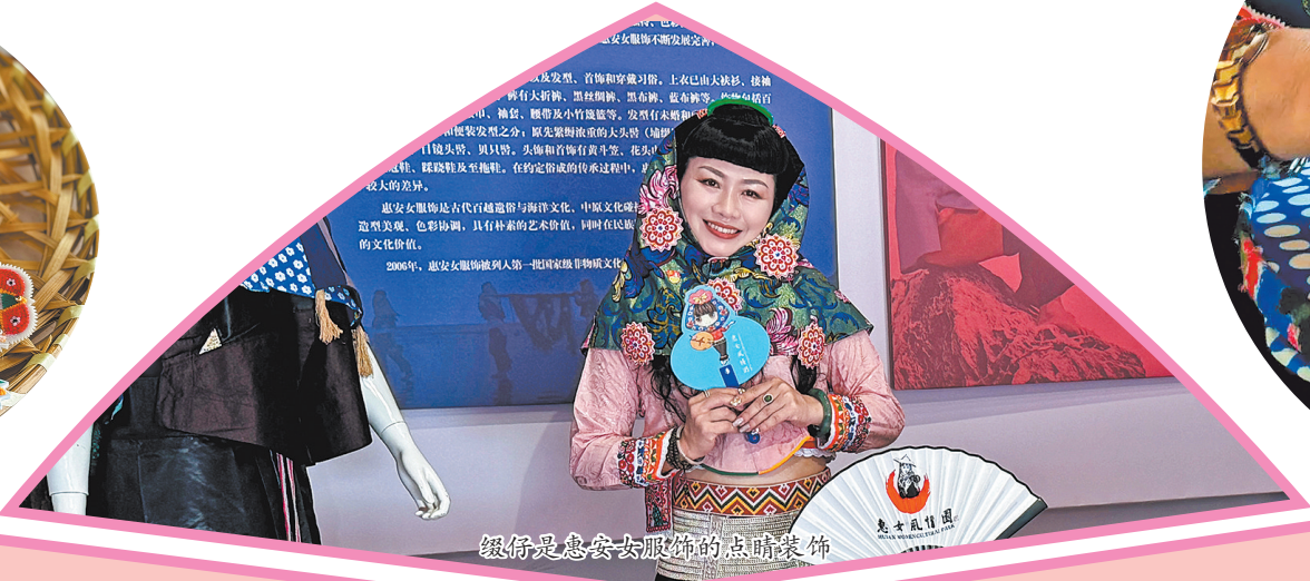
缀仔是惠安女服饰的点睛装饰