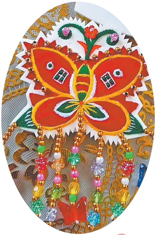
▲蝴蝶造型的缀仔融入珠花装饰