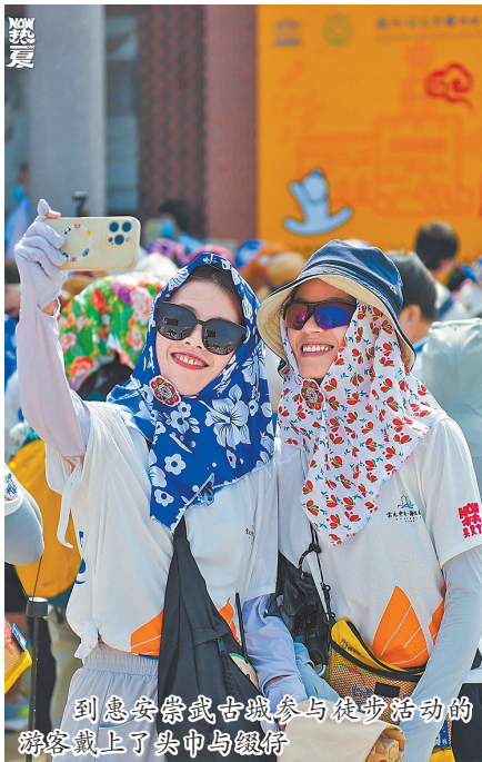
到惠安崇武古城参与徒步活动的游客戴上了头巾与缀仔