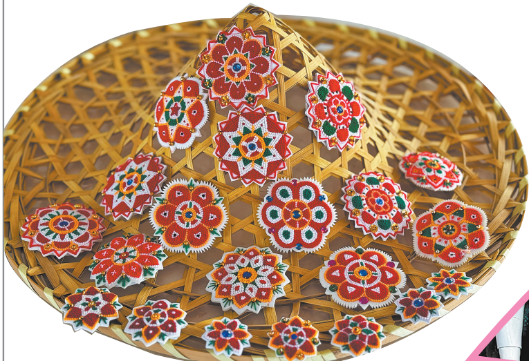
▲琳琅满目的缀仔展现了惠安女服饰的搭配美学