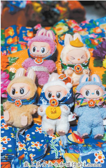
戴上惠安女头巾和缀仔的Labubu