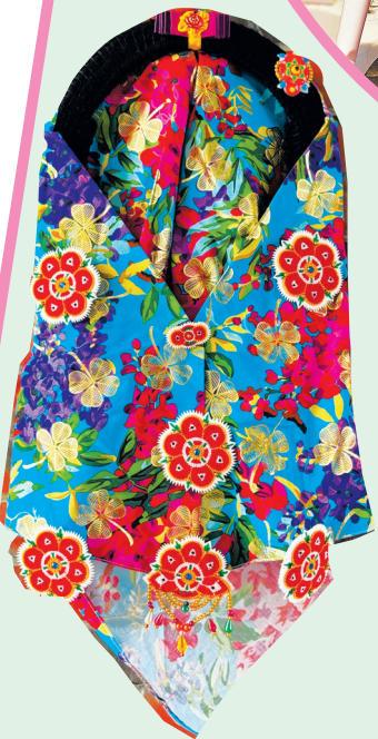
▲缀仔将惠安女头巾点缀得熠熠生辉