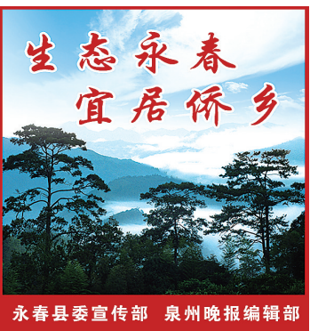
生态永春 宜居侨乡 永春县委宣传部 泉州晚报编辑部