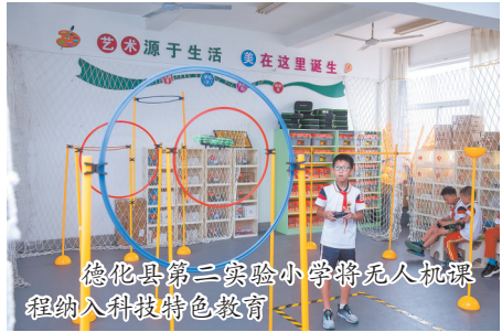
德化县第二实验小学将无人机课程纳入科技特色教育

建设、优化资源布局,强化队伍建设,提升管理效能,全力以赴迎接义务教育优质均衡发展国家督导评估,努力办人民满意的教育,为德化教育事业再谱新章。