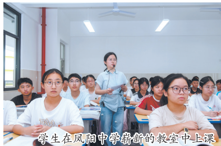
学生在凤阳中学崭新的教室中上课