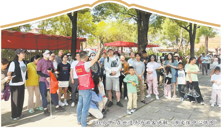
“红马甲”在世遗点为游客讲解

讲解员凭借扎实的知识储备与专业的讲解能力，为市民与游客提供了兼具温度与深度的公益讲解服务。这支队伍汇聚了来自各行各业的党员干部、资深讲解志愿者以及高校学生，多元的背景为讲解带来丰富的视角，也让每一场讲解都浸润着不同层面的理解与共鸣。