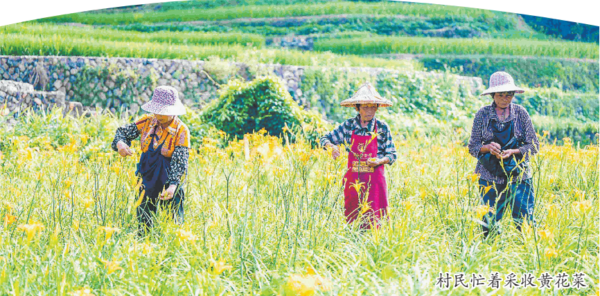
村民忙着采收黄花菜

联建的“化学反应”迅速显现。去年古春村采收季遭遇劳力短缺,联合党委迅速调配联建村劳力10余人火速支援,仅用3天就抢收完50亩黄花菜,挽回经济损失2万元。当得知邻近大田县张庵村数百斤优质干黄花菜滞销时,联建村党组织迅速发起“以购