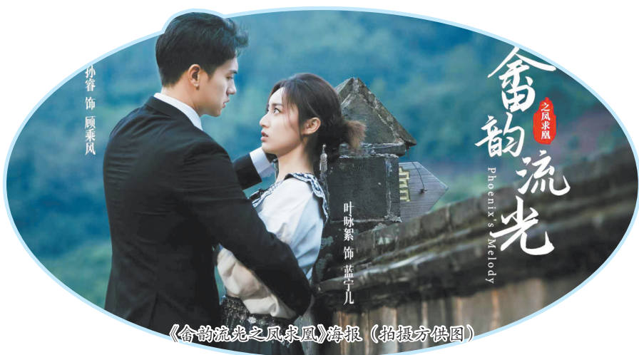
《畲韵流光之凤求凰》海报

《漂洋过海只为你》由泉州市档案馆、福建省西窗文化传播有限公司出品,福建省西窗文化传播有限公司制作,每集9分