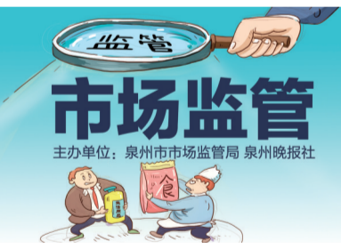
主办单位:泉州市市场监管局 泉州晚报社

针对抽检发现的不合格产品,属地市场监管部门已开展核查处置,督促生产经营经营者诚信经营,履行停止销售、下架、召回和公告等法定义务,依法查处违法违规行为,有效防控食品安全风险。