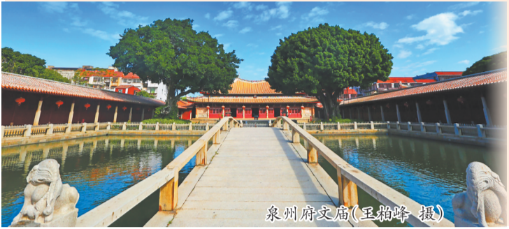
泉州府文庙