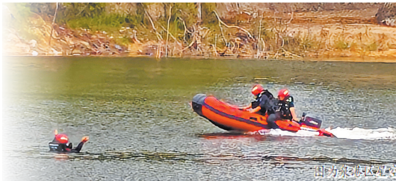
因为水陆空应急救援队正在进行的应急救援训练

此外,该救援中心还与各镇、街建立通联群,邀请村干、网格员加入,形成区、镇、村三级联动网络,实现信息即时互通、资源快速调配。“一旦群众有求助需求,村干部可第一时间在群内反馈,救援队迅速