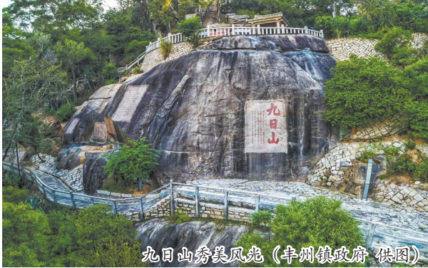
九日山秀美风光