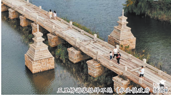
五里桥游客络绎不绝