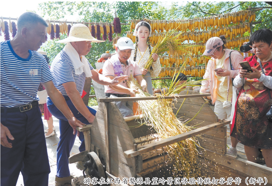
游客在江西省婺源县篁岭景区体验传统打谷劳作

“从传统的商品消费到新兴的服务消费,从线下的实体活动到线上线下融合的创新模式,各地在金秋消费季通过更具特色的农产品、更有力的金融政策支持,为消费者带来了丰富的消费选择,也为市场带来了新活力。”山东大学经济学院教授李铁岗说。