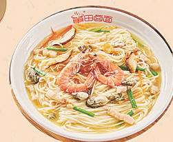
无厨师又地道的卤面