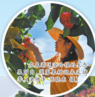
在泉港区涂岭镇的生态果园内,身穿果篮迎接采摘季。