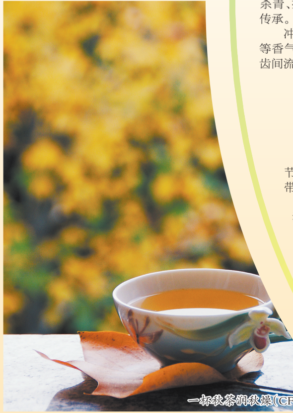
一杯秋茶润秋燥。(CFP 图)