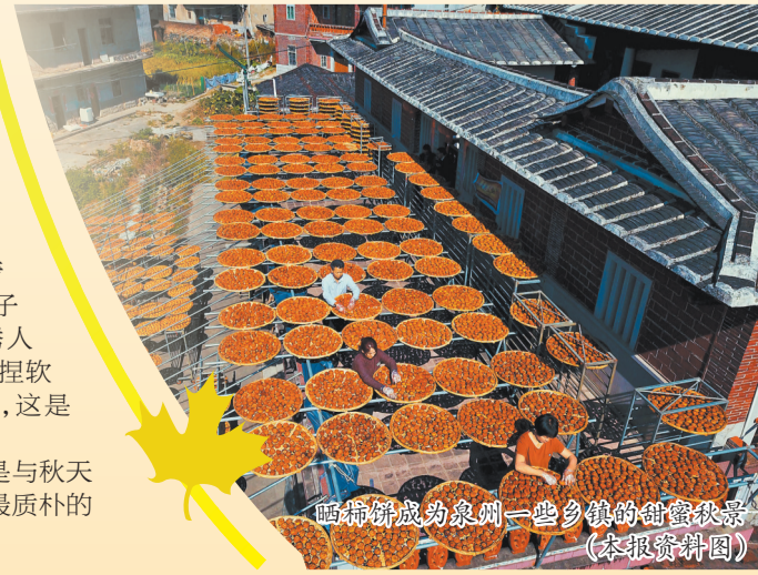
晒柿饼成为泉州一些乡镇的甜蜜秋景。

在泉州的果园里,每一次伸手采摘,都是与秋天的亲密对话;每一口新鲜果实,都是大自然最质朴的秋日献礼。