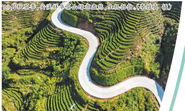
10月秋茶季,安溪群牛茶山绿意盎然,生机勃勃。