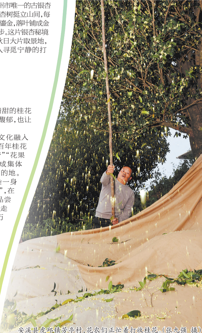
安溪县虎邱镇芳亭村,花农们正忙着打收桂花。

不止于闻香赏花,芳亭村更将桂花文化融入游赏体验的方方面面。近年来,当地依托百年桂花谷进行主题开发,精心打造了“桂宫寻梦”“花果秋韵”“香林花语”等创意文化景观,建成集体验、观光、科普功能于一体的特色旅游目的地。游客至此,可漫步于桂花谷中,尽情沾染一身芬芳;在村民的指导下亲身体验“打桂花”,在落英缤纷间感受传统农事的乐趣;还能品尝现场制作的桂花茶、桂花糕等时令美食;走进桂花文化展区,探寻当地桂花种植历史、桂花品种与文化寓意……在这阵阵秋香中,完成一场由鼻翼牵动的沉浸式“桂香之旅”。