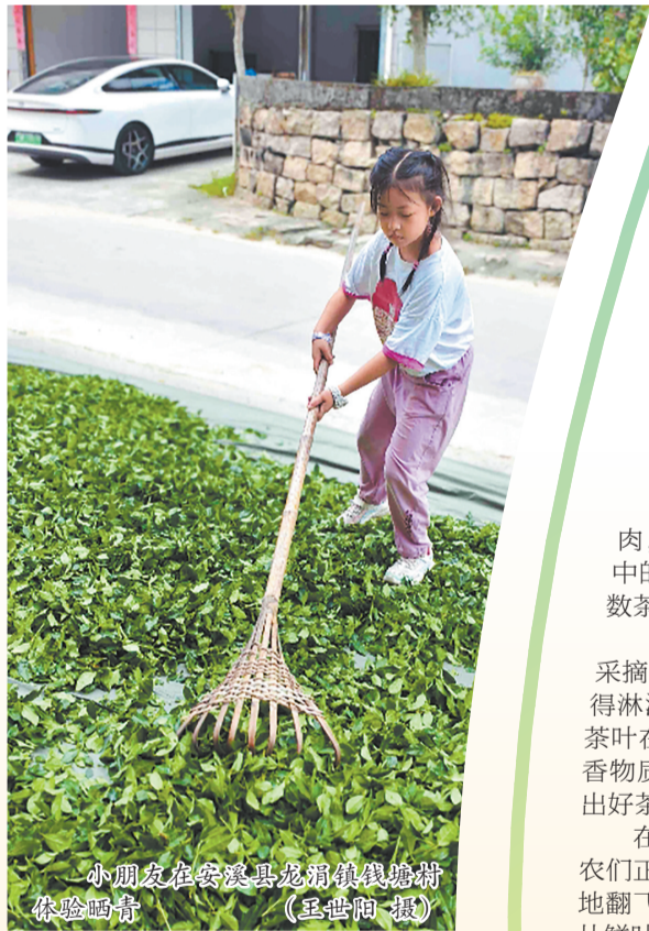
小朋友在安溪县龙涓镇钱塘村体验晒青。