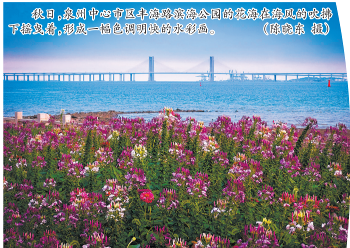
秋日,泉州中心市区丰海路滨海公园的花海在海风的吹拂下摇曳着,形成一幅色调明快水彩画。