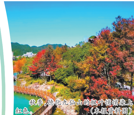
秋季,德化九仙山的枫叶悄悄染上红色。

眼下,泉州中心市区尖峰山云谷寺附近,栗树已经开花结果。金黄色的花朵和红褐色的果实在枝头斗艳,将山林渲染得如梦如幻。