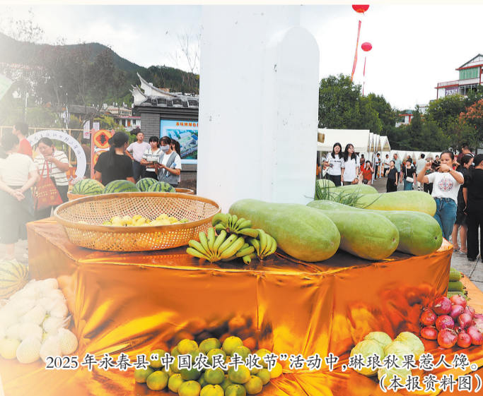
2025年永春县“中国农民丰收节”活动中,琳琅秋果惹人馋。(本报资料图)

若想深度感受茶韵,还可前往芦田镇云岭茶庄园、虎邱镇裕园七星庄等地。千亩茶园间,游客不仅能学习非遗制茶技艺,还可入住茶山民宿,推窗见茶海,枕着茶香入眠。此外,感德、祥华、龙涓等乡镇的茶叶集市热闹非凡,茶商茶客围坐品评,议价声与茶香交织,勾勒出浓厚的茶文化图景。无论你是想亲身感受茶事乐趣,还是单纯品味一杯地道秋茶,安溪的茶园都能让你在舌尖与心间,留存一份难忘的秋日醇香记忆。