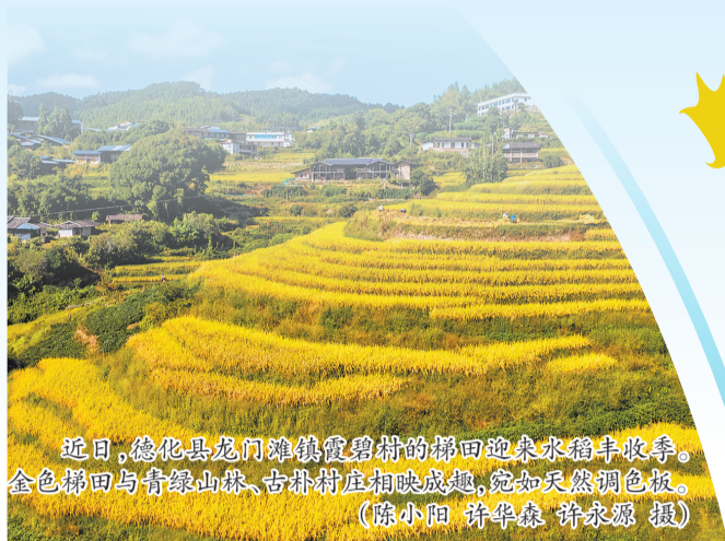
近日,德化县龙门滩镇霞碧村的梯田迎来水稻丰收季。金色梯田与青翠山林、古朴村庄相映成趣,宛如天然调色板。

秋风起,秋意浓。梯田染上灿烂金黄,九仙山上枫叶渐红,桂花暗香正盛,秋茶可口韵醇,枝头硕果累累……泉州的秋天,秋色可观、秋香可闻、秋味可品、秋果可摘,是一场全方位的感官盛宴。不妨带上敏锐的感官,跟随这份秋日漫游指南,一同开启沉浸式赏秋巡游吧。 □融媒体记者 洪娜娜