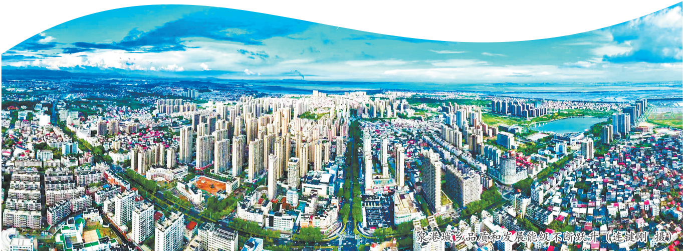
泉港城乡品质和发展能级不断跃升。