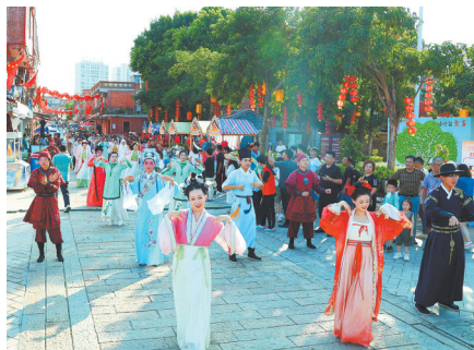
“宋时风华·烟火洛江”洛阳桥古街巡游