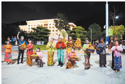
双阳街道印尼风情舞蹈展演