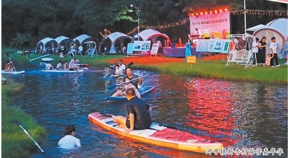
河市镇新街露营嘉年华