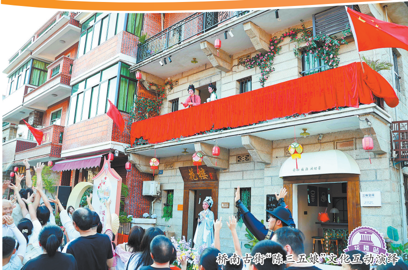
桥南古街“陈三五娘”文化互动演绎