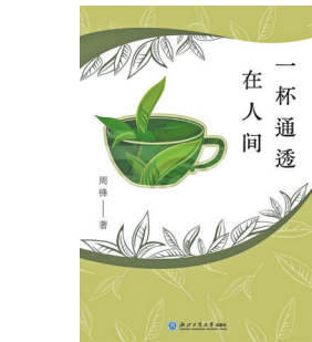
《一杯通透在人间》 周锋 著 浙江工商大学出版社