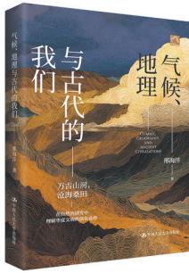
邢海洋 著 中国人民大学出版社

此书从科普和人文的双重视角穿行于天、地、人之间,展现200万年间大自然的伟力与沧海桑田之变,回溯华夏文明的起源,感受人类与天、地的关系。从整个地球到中国大地,今天我们周围的一切与200万年前截然不同,但古今之间却从来没有失去关联,这里包含着大自然的奥秘,也蕴含着人类的奋争。“让历史告诉未来”这一口号,永远不会失去价值,因为回顾过往,重要价值不仅在于获得知识,更能作用于当下。