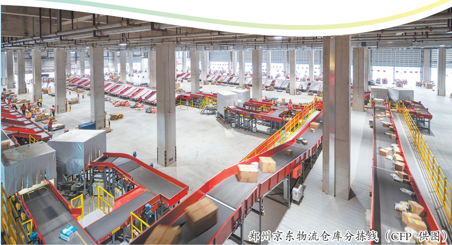
郑州京东物流仓库分拣线

今年“双11”,京东物流、申通、极兔等企业均在自动化能力上进一步提升加码,比拼时效。有从业人士认为,未来行业将继续向智能化、专业化方向发展,进入门槛进一步提升。