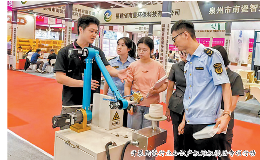
开展陶瓷行业知识产权维权援助专项行动

利、商标等各类知识产权的现场咨询、维权援助等公共服务。同时,工作人员还走访巡查100余个展位,发放知识产权宣传手册200余份,主动向企业介绍知识产权维权援助、纠纷调解、海外知识产权纠纷应对指导等服务内容,对现场发现的专利、商标标注不规范等问题督促整改,引导企业规范参展,树立尊重和保护知识产权的意识。