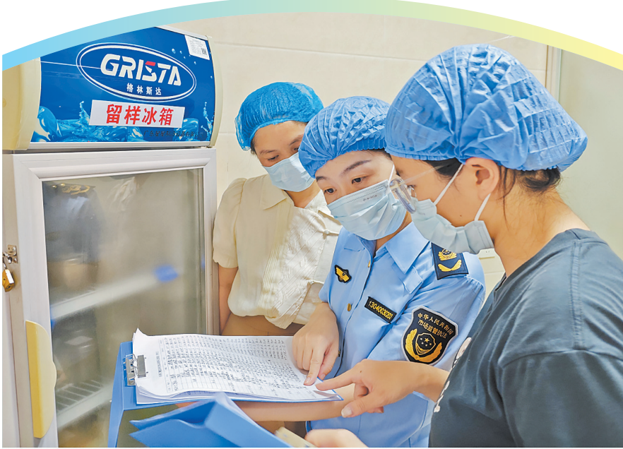
普法人员深入后厨,对照操作规范逐一检查食材储存、餐具消毒、食品留样等环节,现场指导进一步规范加工操作行为,确保食品安全无死角。

在线上传播方面,保障中心精心制作3个主题鲜明的食品安全宣传视频,分别聚焦“落实食品安全主体责任”“餐饮食品留样管理规范”“食品添加剂管理要求”,通过实景讲解等生动形式,将专业知识转化为大众易懂的内容,经泉州市市场监管局公众号推送后,快速获得转发传播,实现“足不出户学食安”。