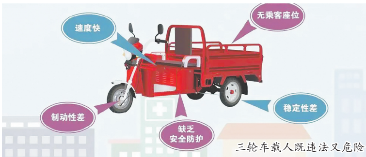
三轮车载人既违法又危险

本报讯(融媒体记者张晓明 通讯员赵美缘 文/图)三轮车因其便捷、经济的特点,成为不少市民短途出行、载货的选择。然而,部分驾驶人安全意识淡薄,违法载人、无牌无证、逆向行驶等交通违法行为频发,给道路交通安全埋下了隐患。为有效防范涉及三轮摩托车肇事伤亡事故,结合秋冬季道路交通事故预防工作,筑牢道路交通安全防线,泉州公安机关决定自即日起至12月底,在全市组织开展三轮车(以燃油为动力方式的三轮摩托车、非标燃油三轮车;以电力为动力方式的电动三轮摩托车、非标载货电动三轮车)交通安全专项整治行动,全力守护群众出行平安。