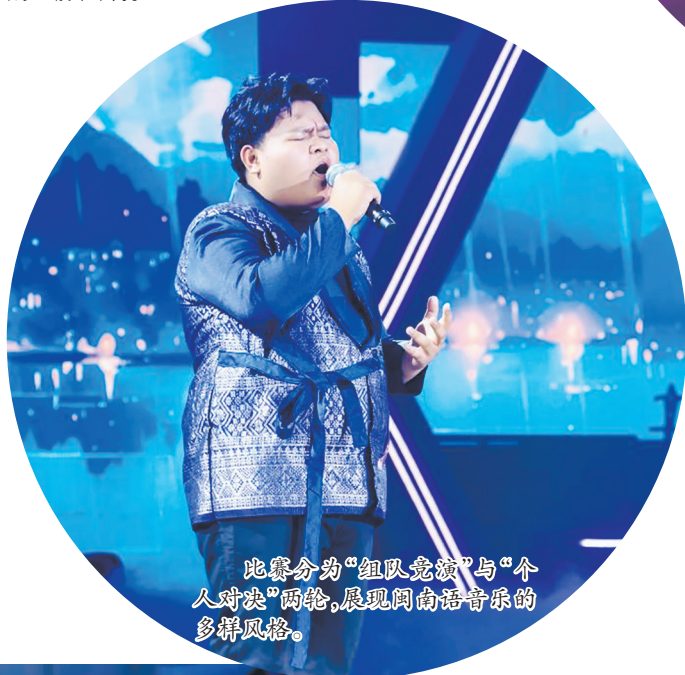
比赛分为“组队竞演”与“个人对决”两轮,展现闽南语音乐的多群风格。

此次全球总决赛通过世界闽南语金曲盛典官方抖音号、视频号,福建电视台旅游频道视频号、微博、抖音,海博TV、直播海峡、福建文旅视频号、安溪融媒视频号,以及YouTube“福建文旅”频道全程同步直播,让全球闽南语系同胞共同聆听这份穿越时空、源自历史深处的血脉回响。