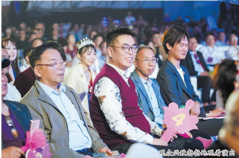
观众兴致勃勃地观看演出