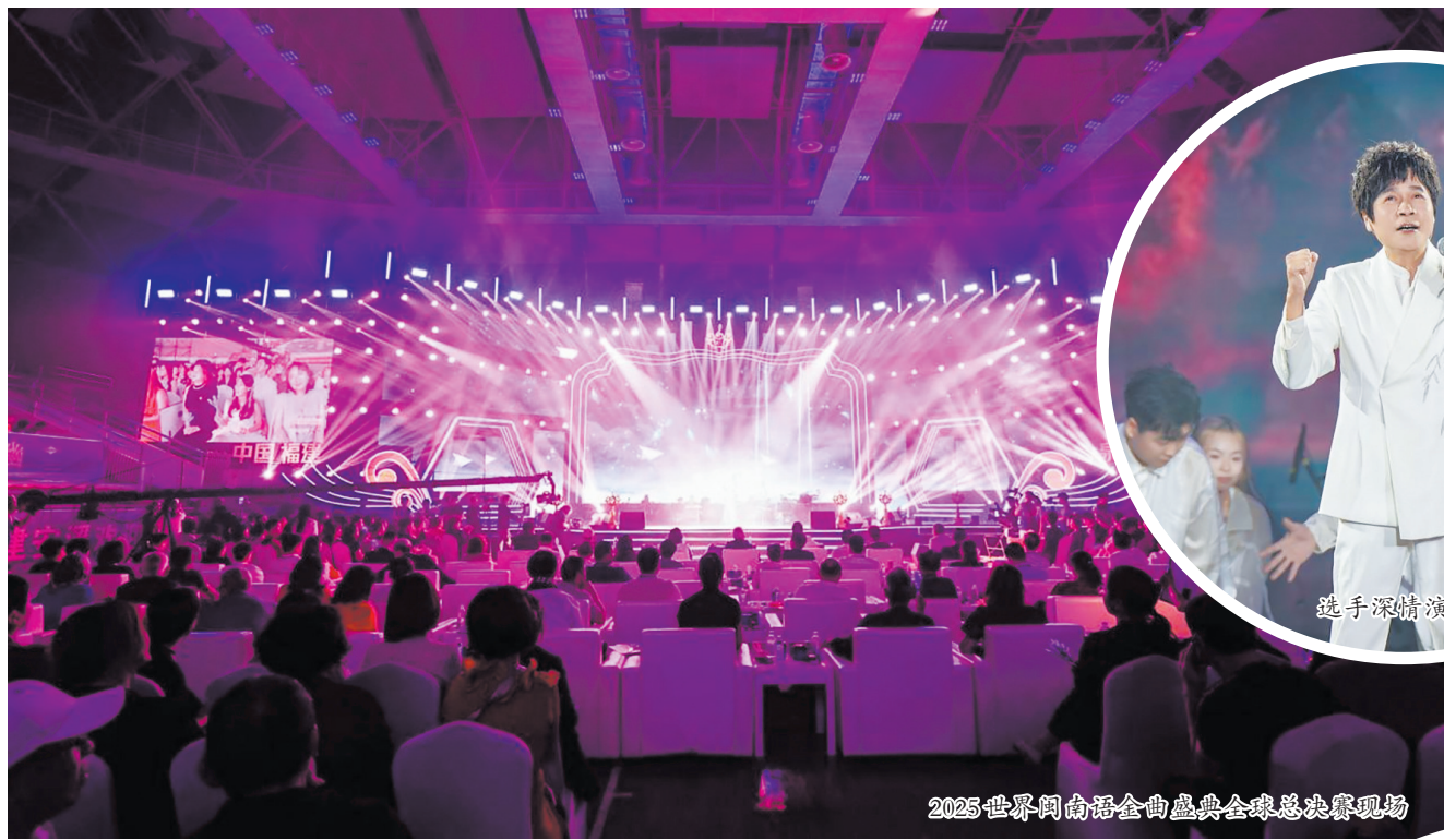
2025世界闽南语金曲盛典全球总决赛现场

□融媒体记者 谢伟端 郑鸿隆 通讯员 吴圣超 王珏/文