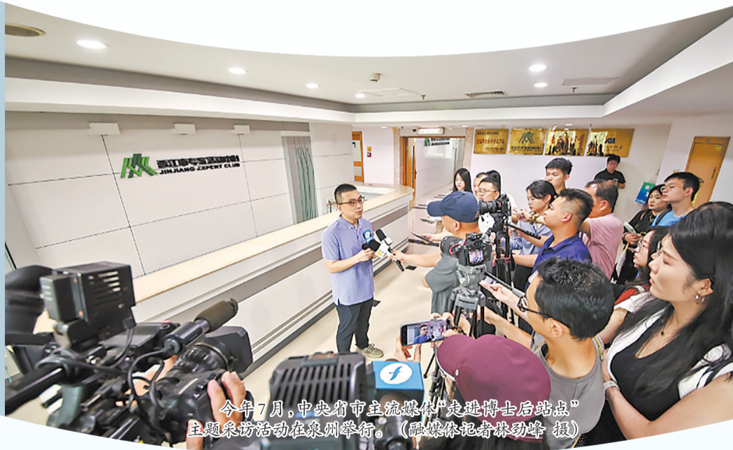
今年7月,中央省市主流媒体“走进博士后站点”主题采访活动在泉州举行。