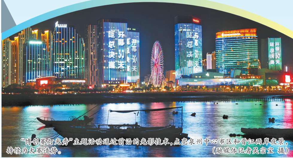
“博创赛灯光秀”主题活动通过前沿的光影技术,点亮泉州中心市区和晋江两岸夜景,持续为大赛造势。