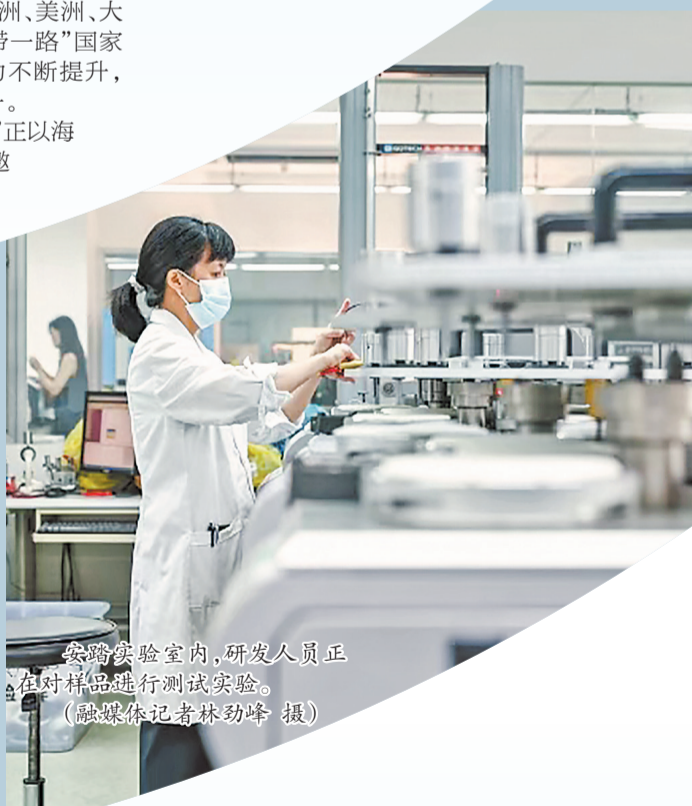
安踏实验室内,研发人员正在对样品进行测试实验。