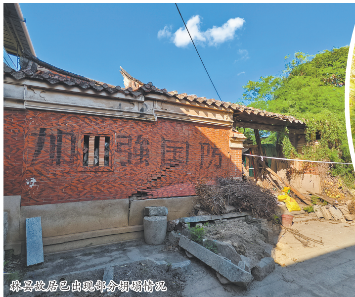
林县故居已出现部分坍塌情况