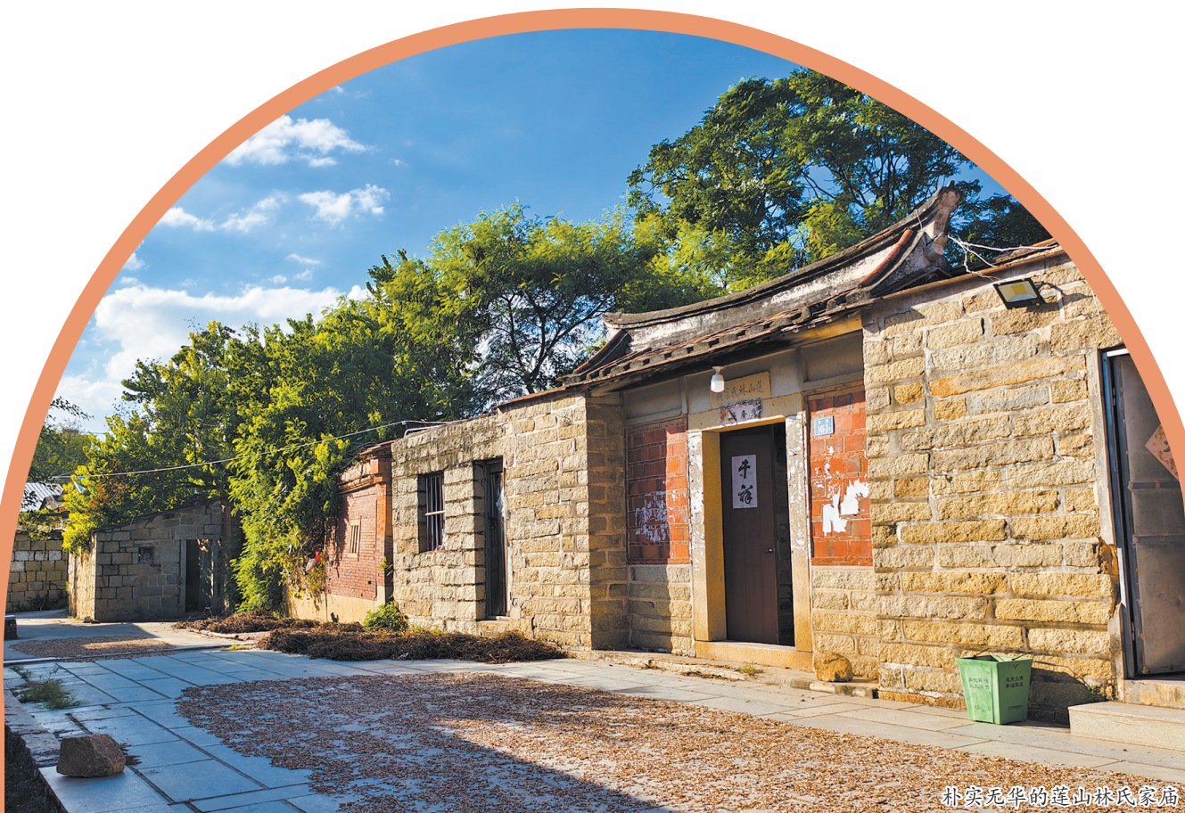
朴实无华的莲山林氏家庙