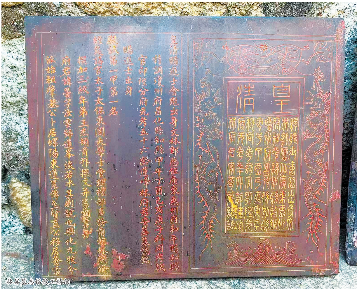
林县墓志铭做工精细