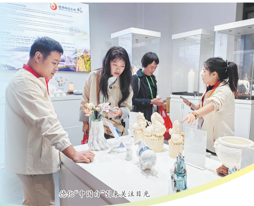
德化“中国白”引来关注目光