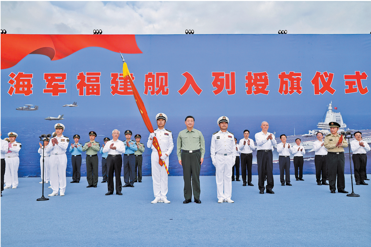
11月5日，我国第一艘电磁弹射型航空母舰福建舰入列授旗仪式在海南三亚某军港举行。中共中央总书记、国家主席、中央军委主席习近平出席入列授旗仪式并登舰视察。这是习近平向福建舰舰长、政治委员授予军旗。（新华）

宽阔的飞行甲板上，4道阻拦索、3个弹射起飞位格外醒目，歼-35、歼-15T、空警-600等新型舰载机依次停放。习近平听取甲板功能布局介绍，不时驻足察看装备设施。习近平同舰载机飞行员亲切交流，详细询问飞机技术性能和电磁弹射特点优势，观看舰载机弹射放飞流程演示。身着多种颜色马甲的航空保障人员看到习主席到来，纷纷围拢过来，向习主席问好，报告各自岗位和主要职责。习近平勉励大家不断提升专业技能和打仗本领，为福建舰战斗力建设贡献力量。