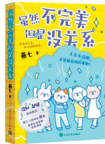
《虽然不完美,但是没关系》 燕七 著 人民文学出版社

本书的最后,作者借由芋妮的播客节目阐释了什么是“健康的情感”,指出在被情感问题困扰时想要找到解决方案最重要的是“先接纳全部的自己,温暖自己,不完美没有关系,让内心充盈平和,打理好自己与自己的关系,才能以健康的心态和方式去构建、维系与他人的关系,让情感健康地流动起来”,从而打通通往幸福的路。