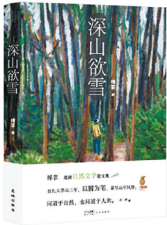
《深山欲雪》 傅菲 著 花城出版社

“除了木柴,唯有一缸冬菜,与我度寒冬”,这是扉页上的一句话,出自《冬菜记》。我喜欢这句话弥漫的安静和清简。深山已雪,万物凝息,虫鸟俱静。一垛柴,一缸菜,一个人,“看着雪