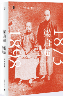
许致远 著 广西师范大学出版社

此书讲述了梁启超从1873年在广东新会茶坑村降生到1898年戊戌变法失败的二十五年人生。梁启超这个来自广东南部一座乡间孤岛的岛民,在清朝稳定的结构中读书、成长、参加科举,又敏锐地察觉到来自外部世界的冲击,偕同师友作出反应。他拜康有为为师,主笔《时务报》,执教时务学堂,参与戊戌变法,在晚清政治舞台上崭露头角。