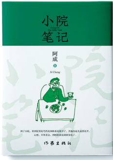
《小院笔记》 阿成 著 作家出版社

人们郁结的心事。阿成深有感触地说:“有个小院,既可以种点瓜果蔬菜,还可以提一把藤椅,坐在小院里一边喝茶,或者一边跟邻居聊天,不亦乐乎。”