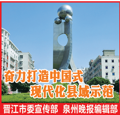
奋力打造中国式现代化县域示范 晋江市委宣传部 泉州晚报编辑部