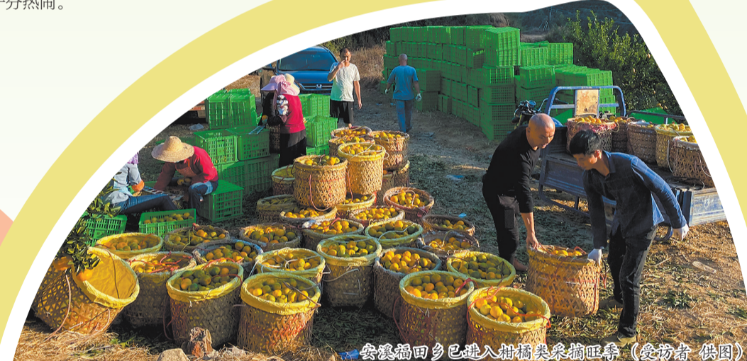
安溪福田乡已进入柑橘采摘季