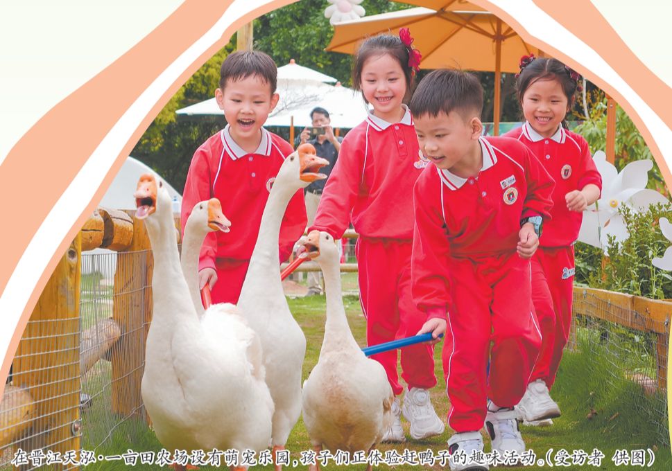
在晋江泉源一亩田农场设有萌宠乐园,孩子们正体验赶鸭子的趣味活动。