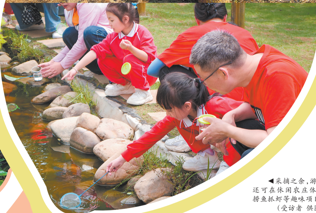
采摘之余,游客可在休闲农庄体验捞鱼抓虾等趣味项目。