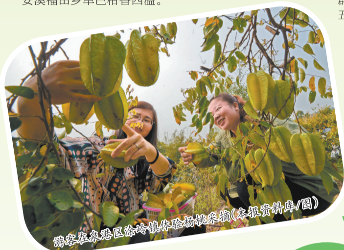
游客在泉州涂岭镇体验杨桃采摘

“自从天气转凉后,来采摘的人越来越多,既亲近自然,又能带走新鲜果蔬,采摘活动很受欢迎。”他介绍,草莓与圣女果已完成栽种,预计明年1月至3月陆续成熟,为下一季的采摘提前埋下“甜蜜伏笔”。