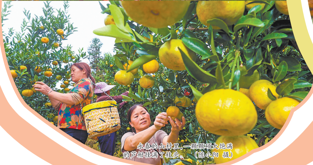
永春的山村里,一颗颗硕大饱满的芦柑挂满了枝头。