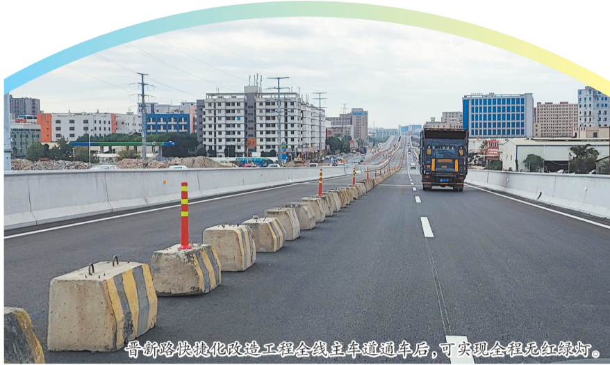
晋新路快捷化改造工程全线主车道通车后,可实现全程无红绿灯。

据了解,晋新路快捷化项目配套路灯照明工程,路线全长约8.740公里。项目主车道按照一级公路兼城市快速路标准进行配套路灯照明,主线为双向6车道,设计速度为80公里/小时;辅道双向4车道,设计速度为40公里/小时;路基宽度60米,沥青混凝土路面结构。主要建设内容包括但不限于道路照明及相关配电箱、桥架、配管、配线、控制系统、灯具的安装及调试等设施配套。该工程