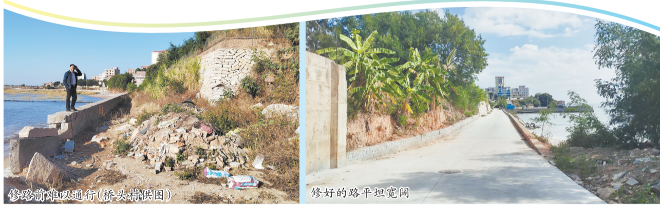
修路前难以通行

在上级部门的支持下,修路项目顺利获批资金。两村村干部反复协商、共同施工,于今年三季度建成这条宽两车道、长约230米的水泥路并正式通车。