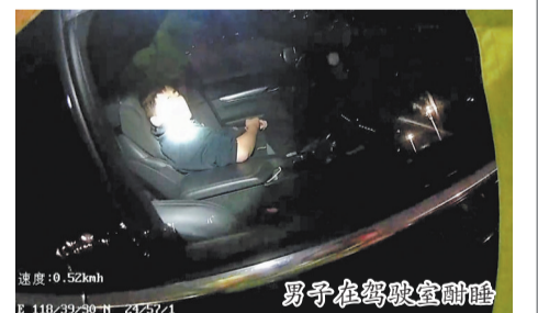
男子在驾驶室酣睡

本报讯(融媒体记者张晓明 通讯员吴梦婕 文/图)当酒精麻痹了理智,当侥幸战胜了法规,驾驶人将高速应急车道当成“睡床”酣卧。这看似荒唐的一幕,近日就发生在沈海高速上。昨日,泉普高速交警支队通报了一起典型的酒驾案例。