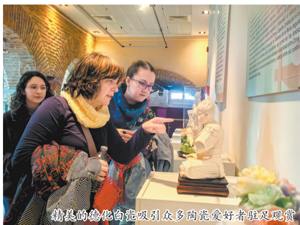
精美的德化白瓷吸引众多陶瓷爱好者驻足观赏