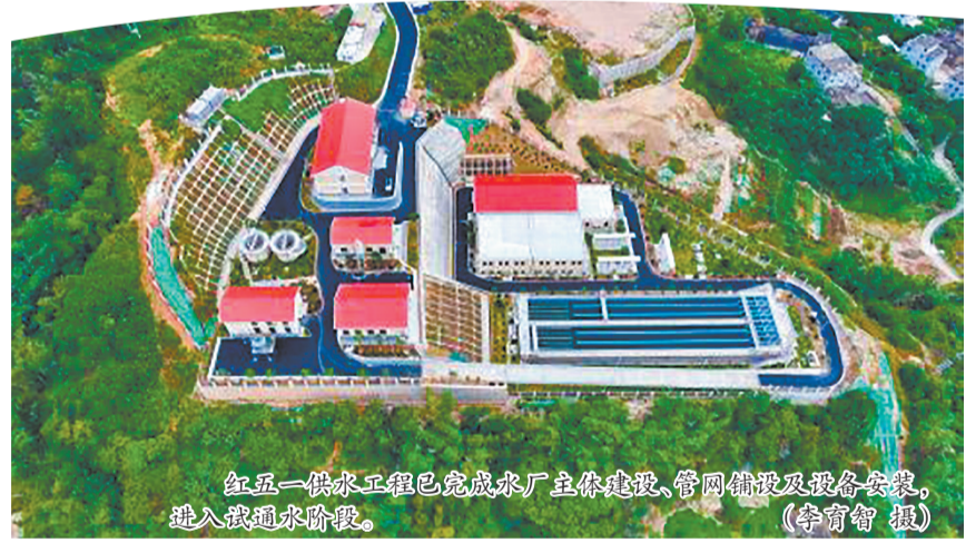
红五一供水工程已完成水厂主体建设、管网铺设及设备安装,进入截通水阶段。