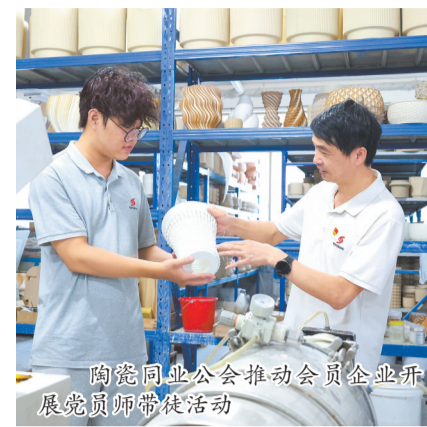
陶瓷同业公会推动会员企业开展党员师徒结对活动

政策辅导只是公会精准服务的一个缩影。陶瓷同业公会常态化组织“企情摸底”走访,并利用理事会、会员大会等各类场合,广泛收集企业在生产经营、技术突破、市场拓展、人才引进等方面的“急难愁盼”问题。同时,坚持以会员需求为导向,