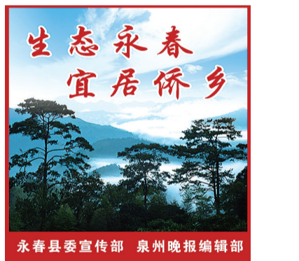
生态永春 宜居侨乡