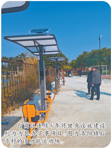
台商区连续5年将健身设施建设列为为民办实事项目。图为洛阳镇后亭村的多功能运动场。

截至目前,全区共有体育场地983个,总占地面积75.01万平方米,人均体育场地面积达2.92平方米,较2020年增长近40%。家门口的“15分钟健身圈”逐步完善,居民健身从“去不了”变为“走就到”,幸福感和获得感得到提升。