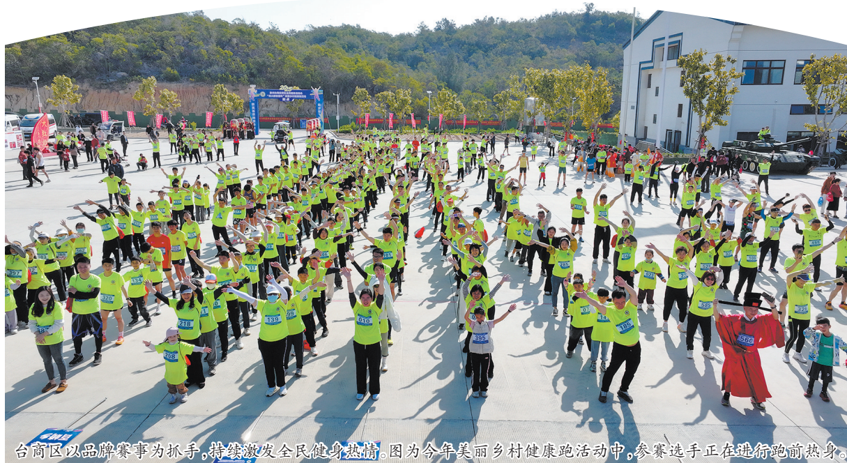
台商区以品牌赛事为抓手,持续激发全民健身热情。图为今年美丽乡村健康跑活动中,参赛选手正在进行跑前热身。