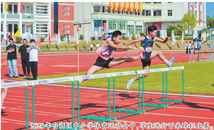
2025年台商区中小学体育运动会中,学生进行百米跨栏比赛。

其中,环百崎湖健步走已连续举办14届,单届参与人数突破1000人,成为区域全民健身的标志性品牌;游泳“村PK”作为全市首创的村级对抗赛,以“村村比拼、户户参与”的形式点燃基层活力,极大增强了村民的归属感与凝聚力。在区级赛事的引领下,各乡镇、村居及体育协会也纷纷开展乒乓球赛、广场舞展演、太极拳展示等活动,全年各类群众性体育活动超过百场,全民健身蔚然成风。