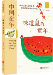
冯杰著 《味道里的童年》 北京联合出版公司

作纸上调味。”另起一段后,他接着说道:“这一单方,可以治疗人生苍老,还能用于返老还童。”我以为,这个目的,冯杰已然实现了。只需想一想,便可知这多么美好。想当年,童年是冯杰的曾经;看如今,童年是冯杰的梦境。那些美味是什么呢?是梦境里开出的花吧?