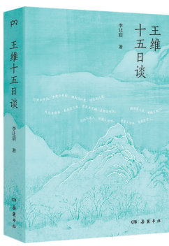
李让眉 著 岳麓书社

青年作家、诗人李让眉以其丰厚扎实的学养、识见和敏锐的感知力,用15篇漫谈追寻诗人王维,细解王维的生平、时代、亲交、情感、宗教、绘画、音乐、诗艺,还原王维的人生境遇与精神世界,破除既有标签,真正读懂王维其人其诗,看懂王维的无奈、挣扎,和他最终对困境的超脱,最终收尾在当下的我们为何要读王维、如何读王维,将古典诗人的光芒折射到现代人身上。