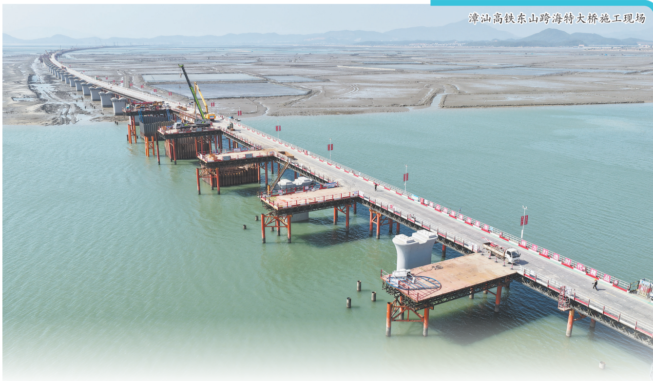
漳汕高铁东山跨海特大桥梁施工现场