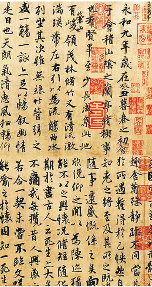
唐冯承素摹《兰亭序》