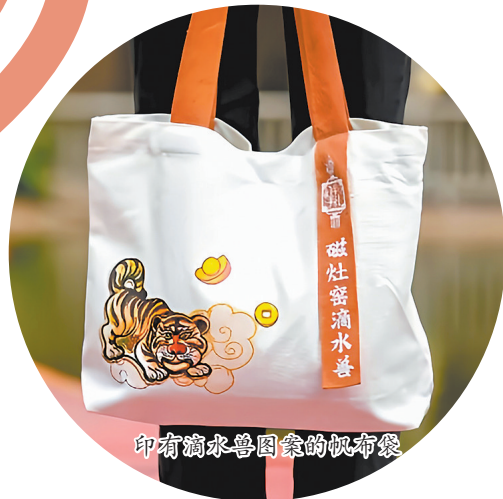
印有滴水兽图案的帆布袋