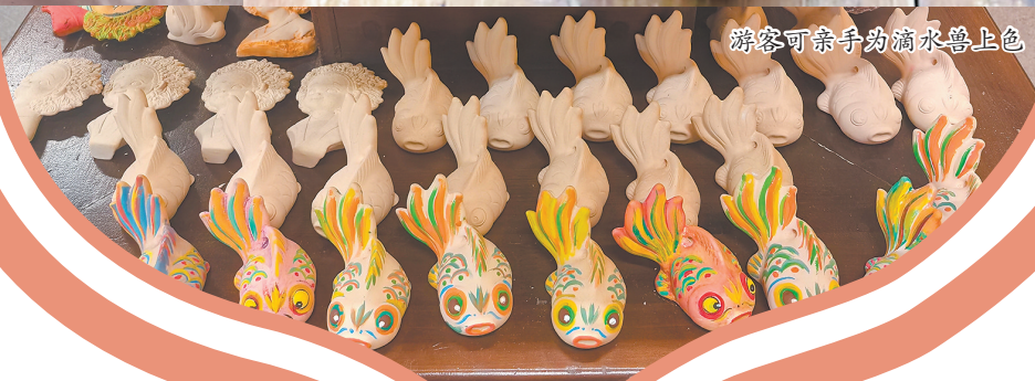
游客可亲手为滴水兽上色