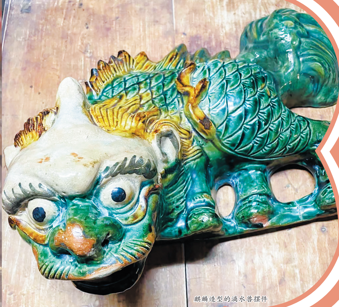
麒麟造型的滴水兽摆件