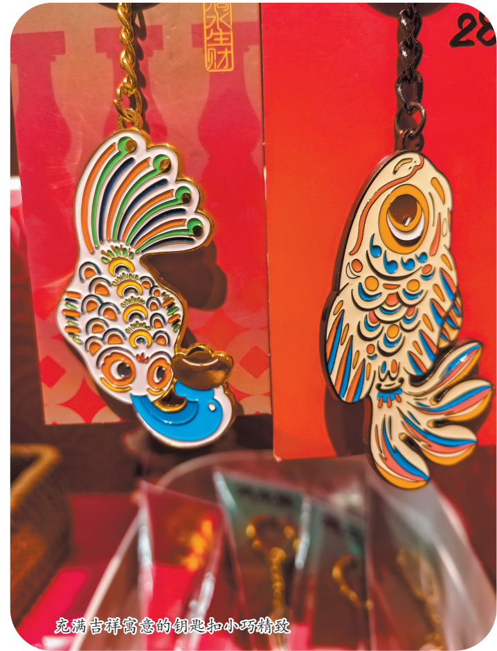
充满吉祥寓意的钥匙扣小巧精致

泉州滴水兽大多为具有吉祥寓意的传统造型,既象征威严与庄重,又寓意细水长流,极具观赏性,更富有闽南本土韵味。颜色鲜艳,造型生动的滴水兽有着多变的形象,分别代表着人们各种美好意愿。金鱼滴水兽寓意年年有余,麒麟造型寄托了麒麟送子的期盼,鸳鸯造型则是幸福的象征,老虎代表勇敢无畏……泉州的滴水兽早已超越了建筑构件的范畴,成为传统文化的特殊符号,见证着古城的历史变迁。对于“下南洋”的侨胞来说,屋檐上的滴水兽更是乡愁的寄托,代替远行的自己守护故土亲人,成为连接海内外的亲情纽带。