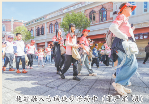
拖鞋融入古城徒步活动中。

11月30日,随着一声鸣笛响起,2025第七届海丝泉州古城徒步穿越活动正式启动,数千名徒步爱好者穿行于古城巷陌,用脚步感知世遗之美。惊艳的是,一双双拖鞋悄然融入徒步队伍,成为一道别样的风景线。 绽放文旅新赛道,早已世界闻名的晋江内坑拖鞋漫步世遗古城,再出发,阅世界。 □融媒体记者 魏晓芳 邱和军 通讯员 蔡东升