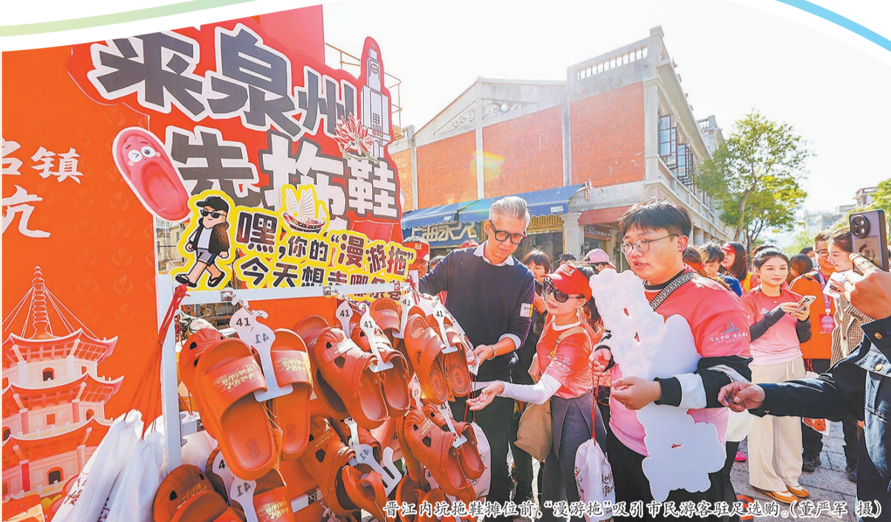
晋江内坑拖鞋摊位前,“爱穿拖”吸引市民游客驻足选购。

11月30日,随着一声鸣笛响起,2025第七届海丝泉州古城徒步穿越活动正式启动,数千名徒步爱好者穿行于古城巷陌,用脚步感知世遗之美。惊艳的是,一双双拖鞋悄然融入徒步队伍,成为一道别样的风景线。 绽放文旅新赛道,早已世界闻名的晋江内坑拖鞋漫步世遗古城,再出发,阅世界。 □融媒体记者 魏晓芳 邱和军 通讯员 蔡东升