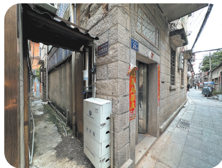
左侧的小巷便是父子花芳巷