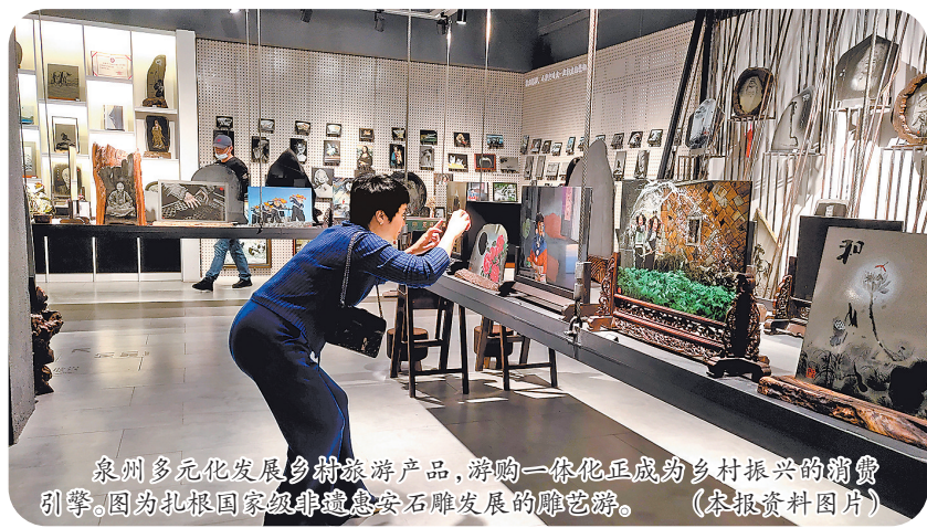
泉州多元化发展乡村旅游产品,游购一体化正成为乡村振兴的消费引擎。图为扎根国家级非遗惠安石雕发展的雕艺游。(本报资料图片)