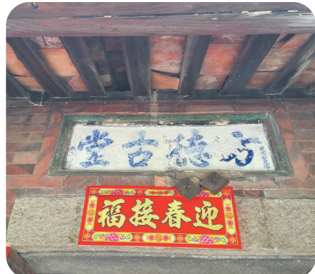
会通巷68号门楣上以前曾有“方德古堂”4个字