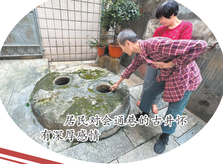
居民对会通巷的古井怀有深厚感情

随着岁月变迁,会通巷内许多故居、祠堂、牌坊如今已经消失无踪,但从流传下来的巷名、古井、老厝中,从鲜活的民俗艺术里,依然可以体会到会通巷在古城沉淀下的市井生活气息。