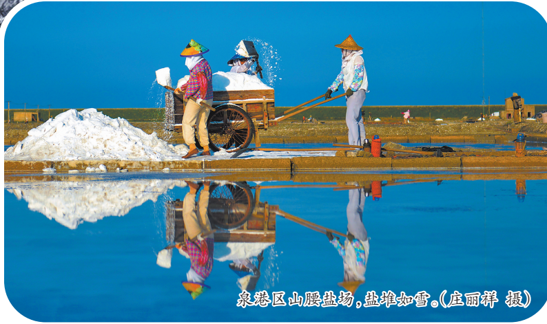
泉港区山腰盐场,盐堆如雪。