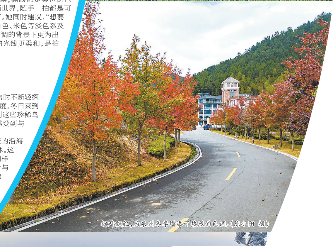
枫叶飘红,为泉州冬季增添了热烈的色调。