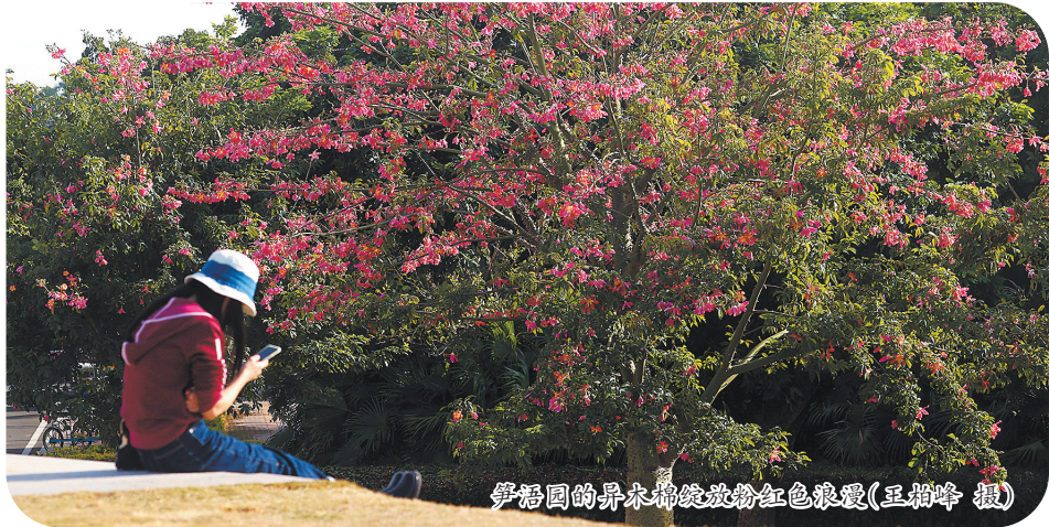
笋浩园的异木棉绽放粉红色浪漫

泉州市区北滨江公园的笋浩园、沉洲园,东湖公园、府文庙,以及泉州台商投资区的海上丝绸之路艺术公园、亚洲园等地正被一抹抹温柔的“少女粉”轻轻点亮,亭亭玉立的“美人树”异木棉正悄然盛放,其花期较长,每年