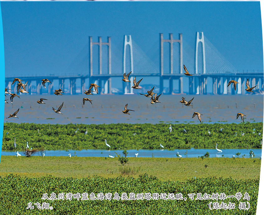
从泉州湾畔蓝色港湾美兰湿地附近远眺,可见红树林一带鸟儿飞翔。