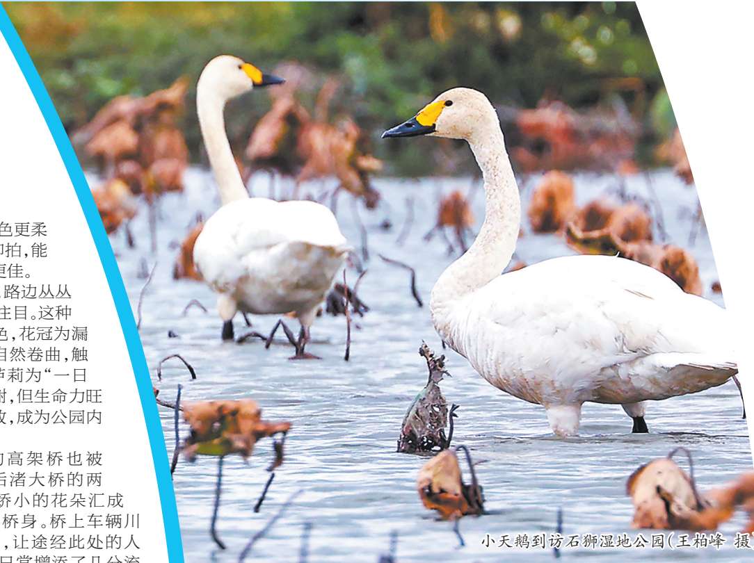
小天鹅到访石狮湿地公园

此外,位于洛阳江附近的沿海湿地滩涂,有数千亩红树林。这片郁郁葱葱的生态屏障,同样为海鸟提供了理想的觅食与休憩场所,是另一处候鸟聚集的重要栖息地,也自然成为市民游客沉浸式亲近候鸟、感受自然野趣的优选基地。