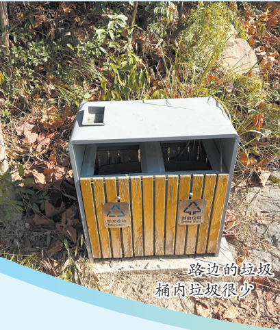
路边的垃圾桶内垃圾很少

记者在紫帽山福道入口处看到了一个分类垃圾桶,桶内有大半桶杂物,垃圾桶周围散落着一些塑料袋和瓶盖。沿步道走了约10分钟,在坡边草丛旁又看到一个垃圾桶,桶内垃圾很少,附近却散落着不少烟蒂,衬得山景多了几分杂乱。