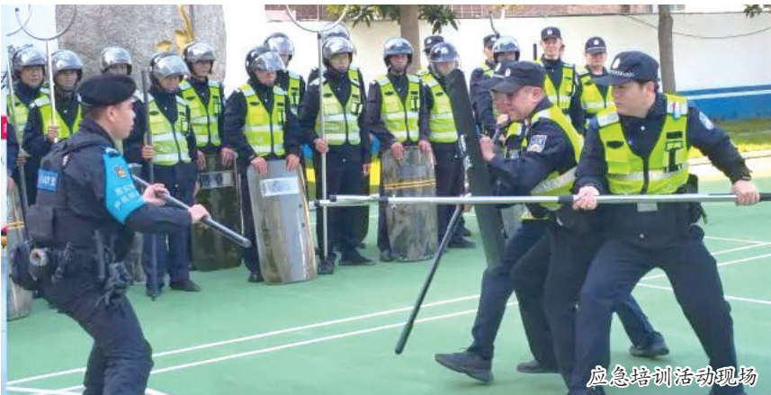
应急培训活动现场

本报讯(融媒体记者张文璋 通讯员康玲 张希达 文/图)为扎实推进最小应急单元建设,把安全技能送到群众身边,日前,惠安县公安局巡特警反恐大队开展“送教上门”“送教下乡”活动,深入辖区校园、乡镇,为保安员、教职工送上干货满满的实战培训,用“小单元”守护群众身边的“大平安”。