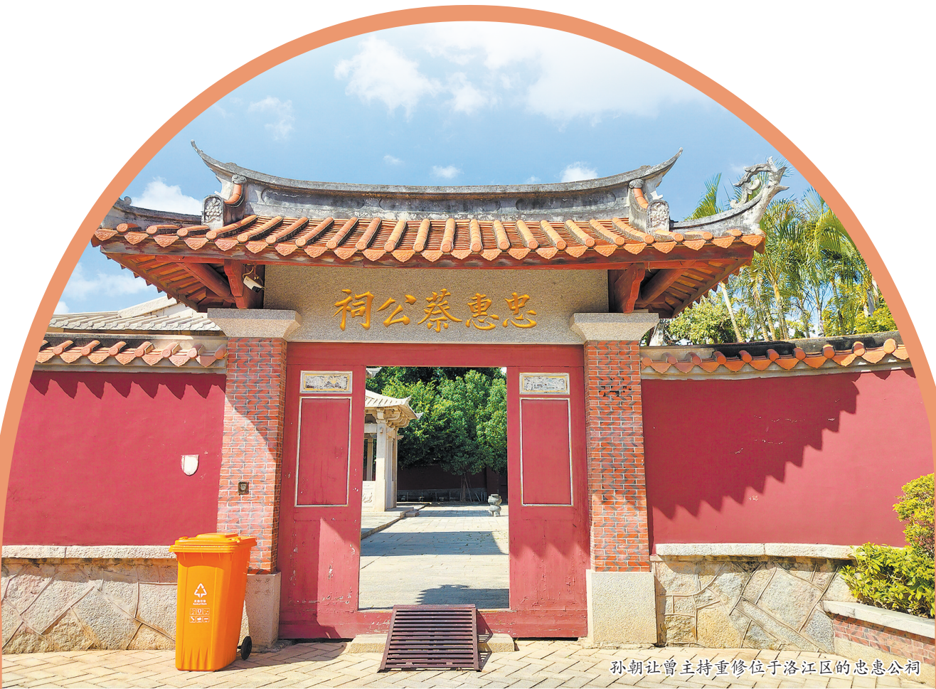
孙朝让曾主持重修位于洛江区的忠惠公祠

综合以上信息推算,孙朝让康熙年间任职泉州知府的时间大约在康熙二十三年至二十四年之间。