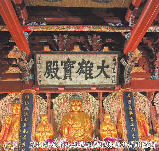
泉州开元寺大雄宝殿悬挂孙朝让手书匾额