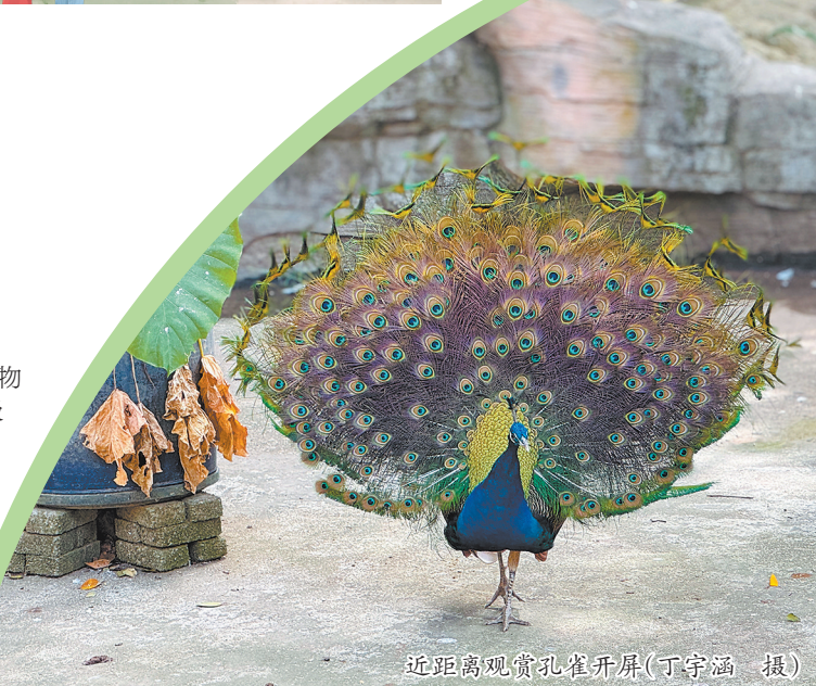
近距离观赏孔雀开屏