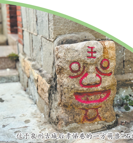
位于泉州古城后孝悌巷的一方萌兽“石敢当”