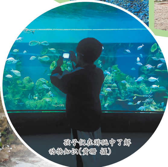
孩子们在游玩中了解动物知识