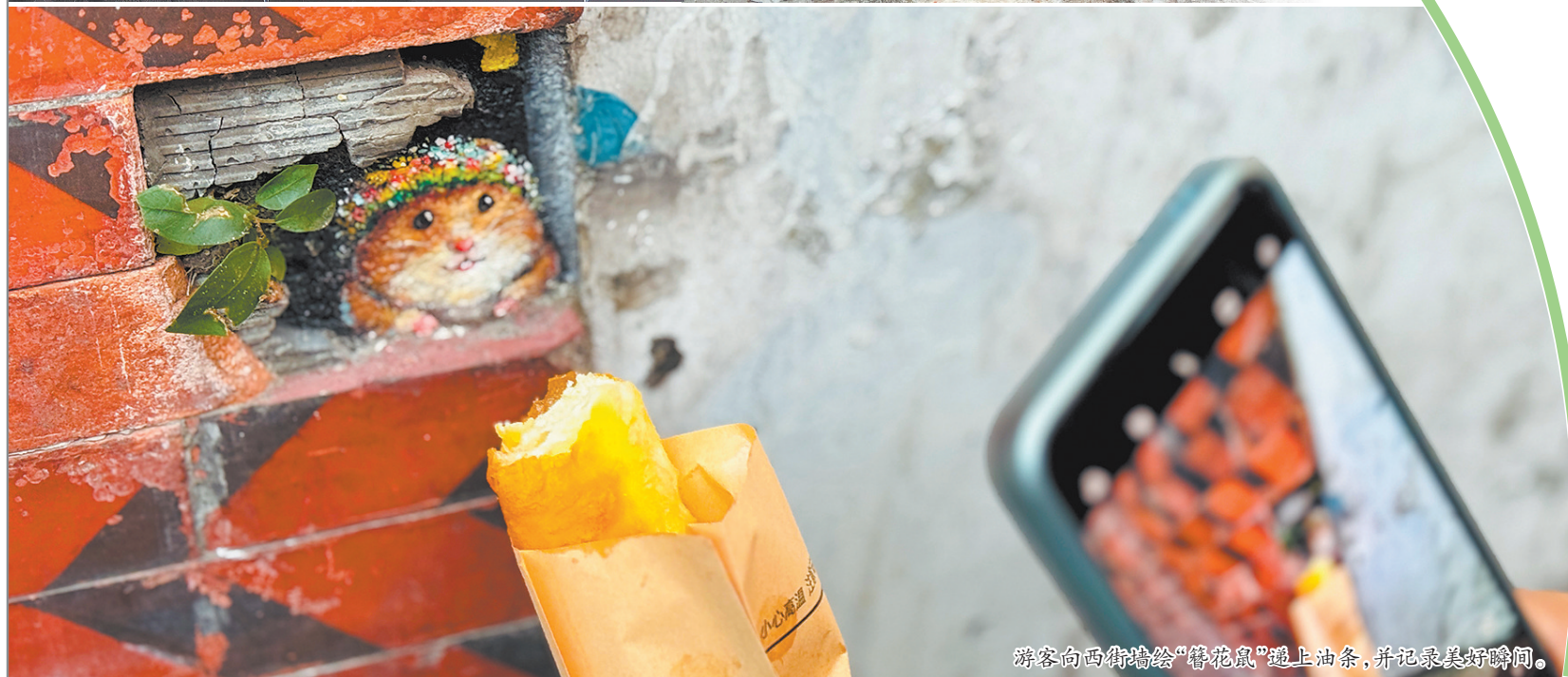
游客向西街墙绘“簪花鼠”递上油条,并记录美好瞬间。

除了由来已久的“老住户”,古城内还有新“萌友”。近年来,在西街路口的墙边一角,由绘画博主“葛多多不多”创作并精心修补的“簪花鼠”墙绘,已成为一处动人的风景。这只头戴蟳埔簪花围的胖墩墩小仓鼠,俏皮地趴在墙角,吸引无数路人驻足拍照。记者近日探访时,恰好看到有游客特意将刚买到的热乎乎油条递到“簪花鼠”嘴边,正在记录这充满童趣的互动瞬间。这幅墙绘因可爱的形象走红,更值得一提的是,“葛多多不多”在得知墙体褪色后,专程返回泉州,精心修补“簪花鼠”,暖心的故事成为古城温暖的色彩。