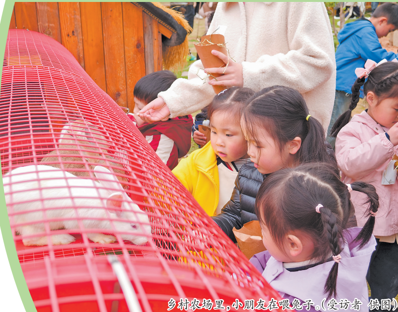
乡村农场里,小朋友在喂兔子。