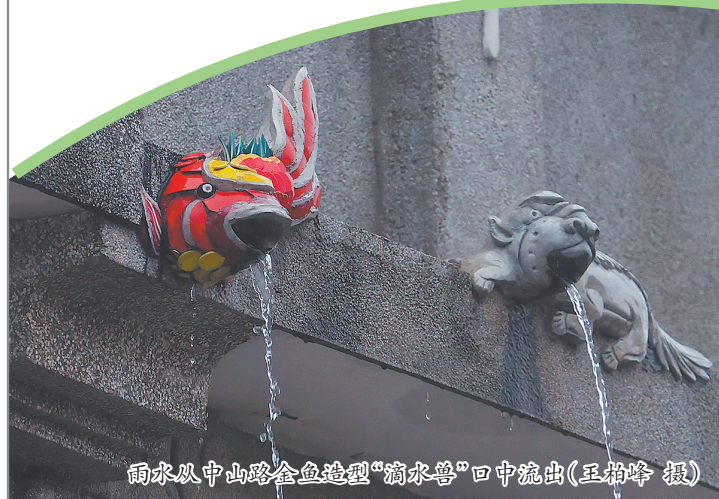
雨水从中山路金鱼造型“滴水兽”口中流出

在惠安崇武镇橘岩古渡码头的滨海农场,则让萌宠之旅添了一抹浪漫,萌化人心的梅花鹿与柯尔鸭是这里的“人气担当”,大小朋友们可以边撸萌宠,体验一日“海边农场主”的乐趣,边欣赏落日余晖下的大海,惬意又治愈;在泉州台商投资区洛阳镇前园村的稻香园农场里,小小饲养员们不仅能抓泥鳅、喂兔子吃胡萝卜、看番鸭游泳,还能集结小伙伴们猫着腰、踮着脚,在田埂草丛间仔细翻找鸭蛋,乐趣多多。这些满是童趣的乡村农场,仿若独具特色的乡村版“疯狂动物城”。它们以接地气的方式,让孩子们在与萌宠的亲密相处中亲近自然、增长见闻,也让家长们在陪伴孩子的过程中重温童年时光,让亲子相处富有温馨与野趣。