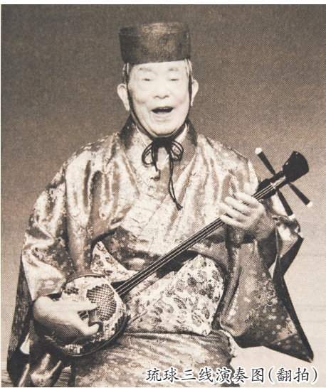
琉球三线演奏图(翻拍)