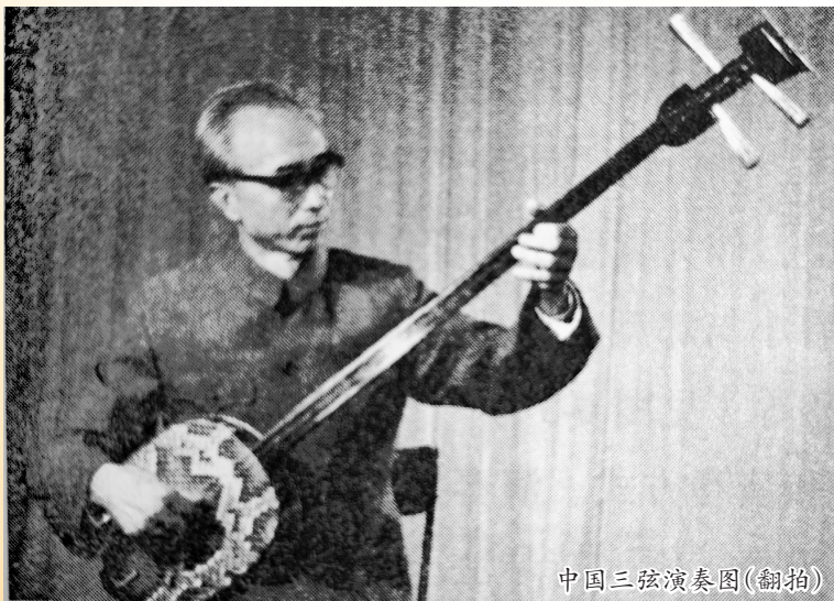
中国三弦演奏图(翻拍)

每一堂课都洋溢着家校互动的温度,孩子们专注投入,积极体验,在实践中收获成长。此次活动推动家长深度参与校园教育,实现家庭资源与校园教育的有机融合。泉州市实验小学相关负责人表示,将持续深化家校共育模式,推动家长成为校园教育的重要合作伙伴,以家校同心的合力为学生健康成长保驾护航。