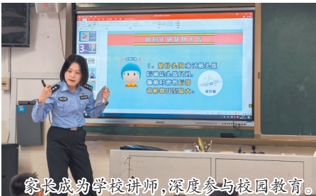
家长成为学校讲师,深度参与校园教育。

本报讯(融媒体记者陈森森/文)近日,泉州市实验小学邀请各班家长化身“特邀教师”走进校园,带来精心筹备的特色课程。此次活动不仅为孩子们的学习生活注入新鲜活力,也搭建起家校沟通的坚实桥梁,让育人合力在互动中不断凝聚。