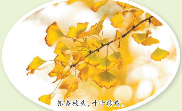
银杏枝头,叶子转黄。

眼下,泉州森林公园的银杏小树林许多叶子已经转黄,在阳光照耀下呈现金黄的迷人色彩,带来浓浓的暖意。连日来,不时有市民、游客前往游玩,将笑容与这样诗意的景象收入镜头之中。如何找到这片银杏林?从市区东海生态路中段山线绿道终点(八号公厕旁),沿游步道往森林公园四角亭方向走几十米就能到达。据悉,银杏黄叶期较短,最佳观赏期可能只有一两周,喜欢的朋友可得抓紧了。