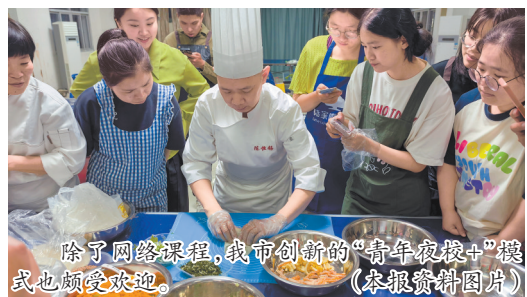
除了网络课程，我市创新的“青年夜校+”模式也颇受欢迎。

《2024中老年人“教育+”增长蓝皮书》数据显示，线上学习方式已覆盖九成中老年兴趣学习人群。其中，94%的受访者认为，网络课程比传统面授更具优势，既可以随时随地学习，节省时间和交通成本，又有多样化的课程选择，内容更生动有趣。在学习渠道选择上，66%的中老年人首选短视频或直播平台，55%的学习者会在课程结束后加入对应社团或俱乐部，通过定期交流延续学习体验。