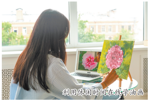
利用休闲时间在线学画