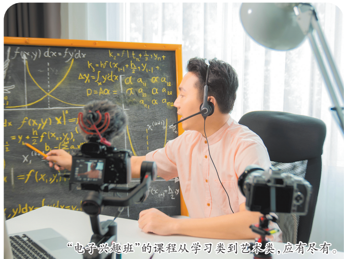
“电子兴趣班”的课程从学习到艺术类，应有尽有。

选课过程中，要保存广告宣传页面、聊天记录、支付凭证、合同协议等材料。一旦发生消费争议，可凭证据拨打12315投诉，依法维护自身合法权益。