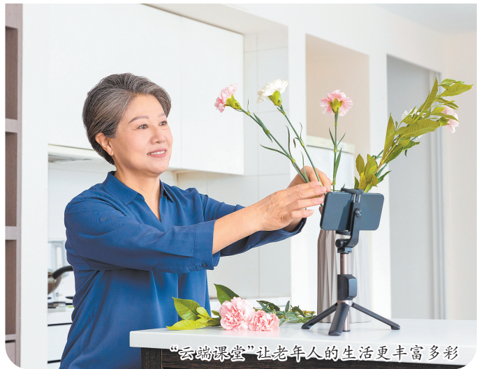
“云端课堂”让老年人的生活更丰富多彩