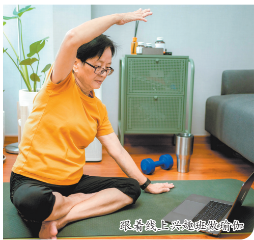
跟着线上兴趣班做瑜伽