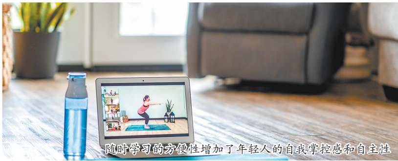
随时学习的方便性增加了年轻人的自我掌控感和自主性