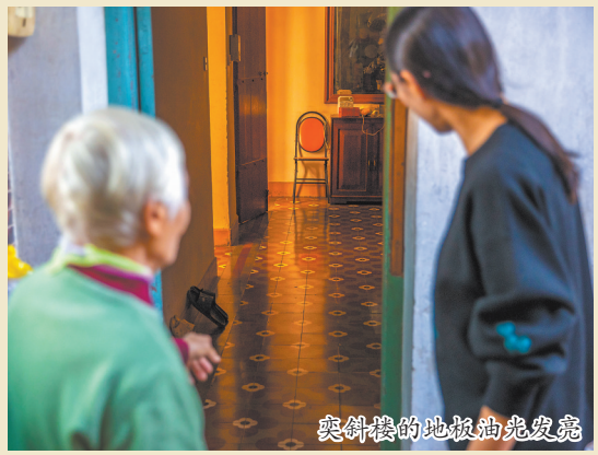
奕斜楼的地板由光发亮