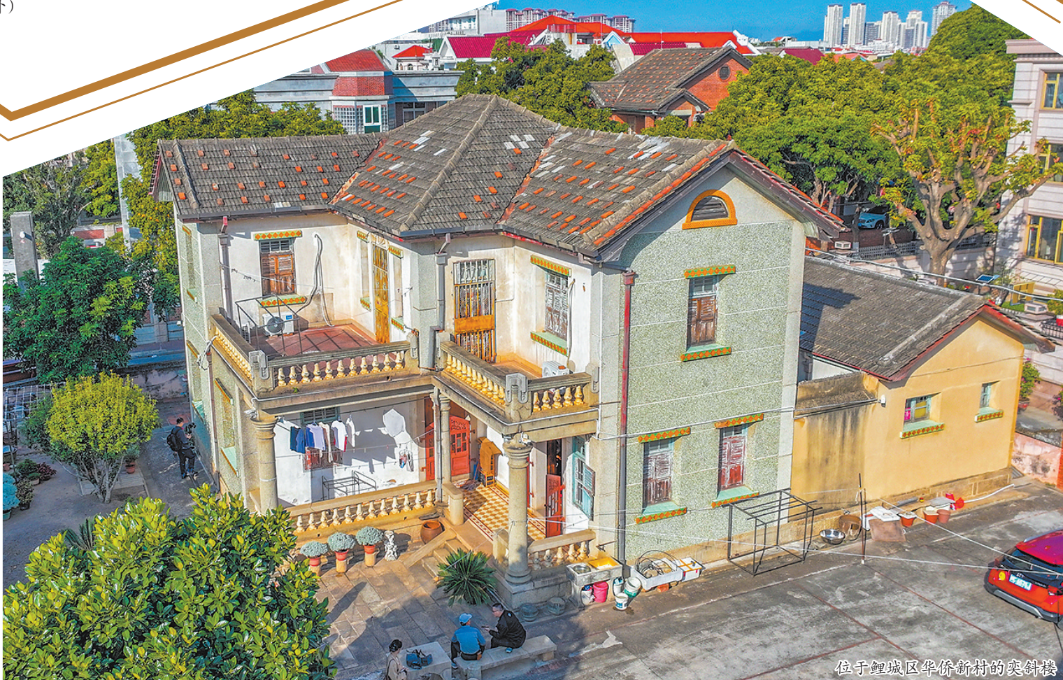
位于鲤城区华侨新村的奕斜楼