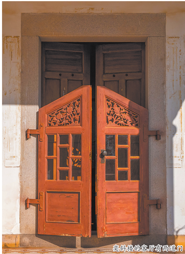
奕斜楼的客厅有两道门

感恩,应是这个世界上最坚韧、最芬芳的种子了。当“受人滴水之恩,当以涌泉相报”这句古老谚语,被一位闽南华侨用一生实践,并最后凝固成建筑,凝固成学校,凝固成水库,凝固成长者食堂里的饭菜香时,它拥有了穿越时空的深远意义和巨大力量。