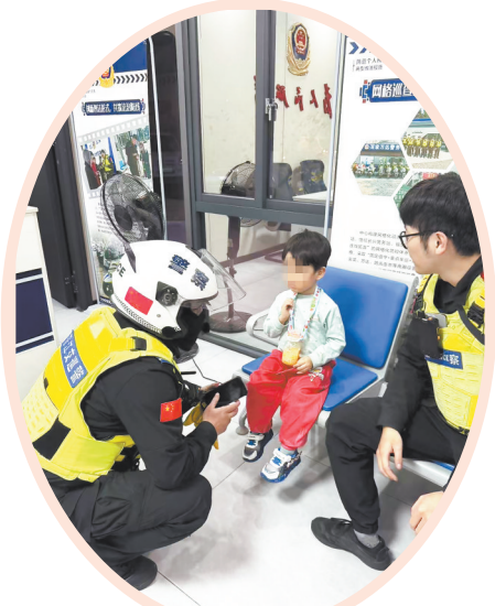
晋江交巡警快速响应,助走失男童归家。

本报讯(融媒体记者张晓明 丁荣汉 通讯员张虹艺 蒋巧玲 文/图)“人民警察为人民,热心帮助暖人心”——近日,这面锦旗被送至晋江市公安局巡防一体化快警务中心百宏万达警务站,赠送者再三感谢警务人员在其孩子命悬一线时的救命之恩。